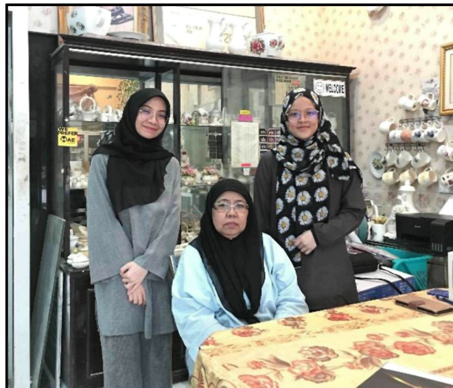
Rajah 2: Penemubual bersama Tokoh Kraf Negara 2020.