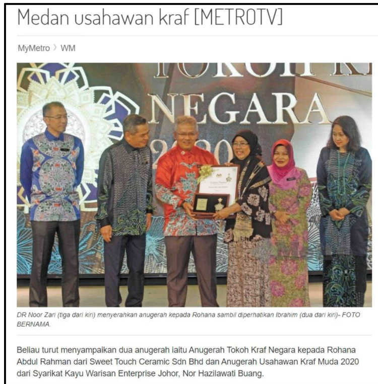
Rajah 1: Keratan akhbar atas talian mengenai penyampaian Anugerah Tokoh Kraf Negara 2020.