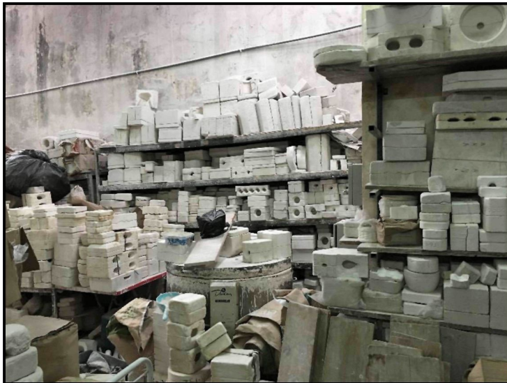
Rajah 8: Peralatan yang digunakan oleh Sweet Touch Ceramic.