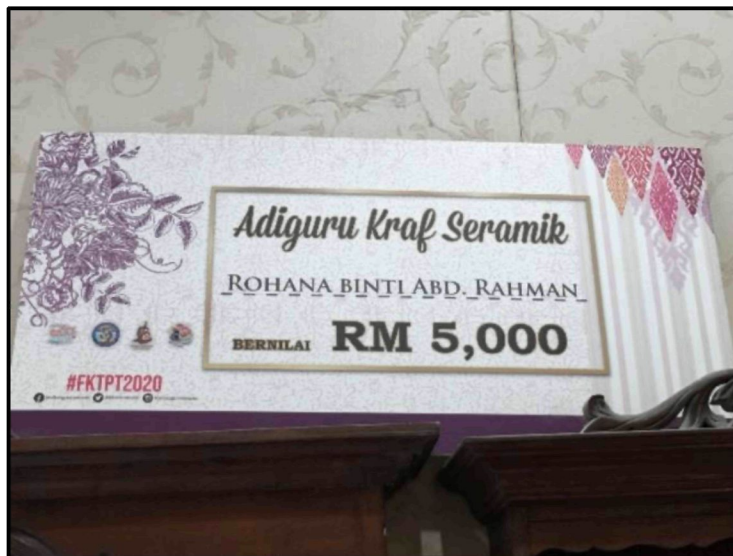
Rajah 4: Hadiah Adiguru Kraf Keramik.