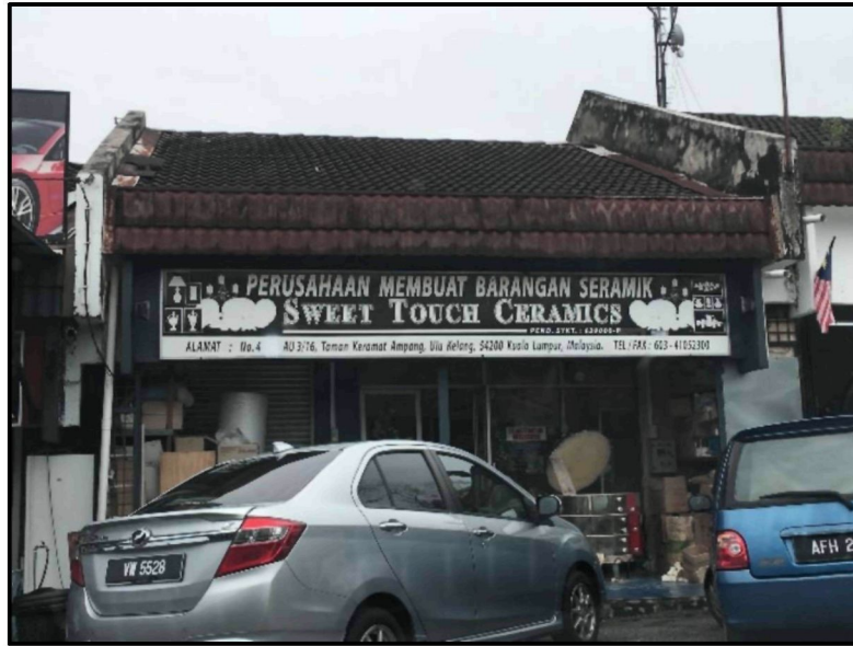
Rajah 5: Kedai Sweet Touch Ceramic di Kuala Lumpur.