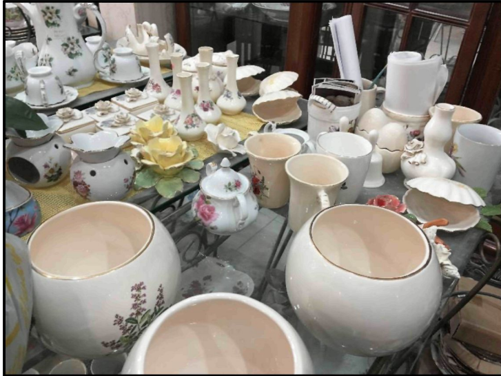
Rajah 7: Antara barangan seramik Sweet Touch Ceramic.