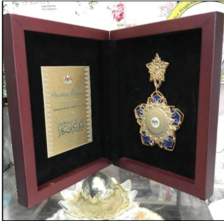
Rajah 3: Pingat Anugerah Tokoh Kraf Negara 2020.