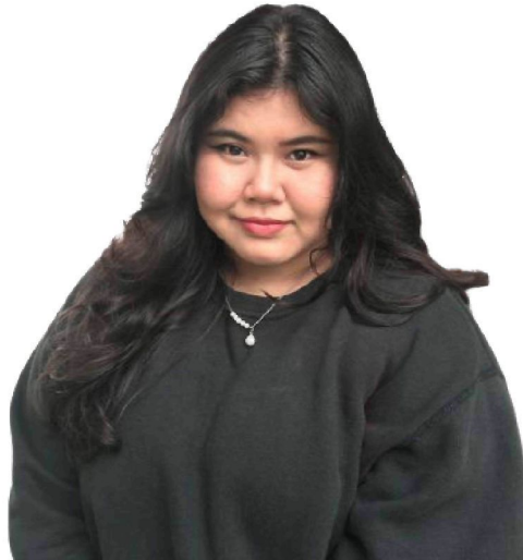
Gambar 1: penemubual pertama