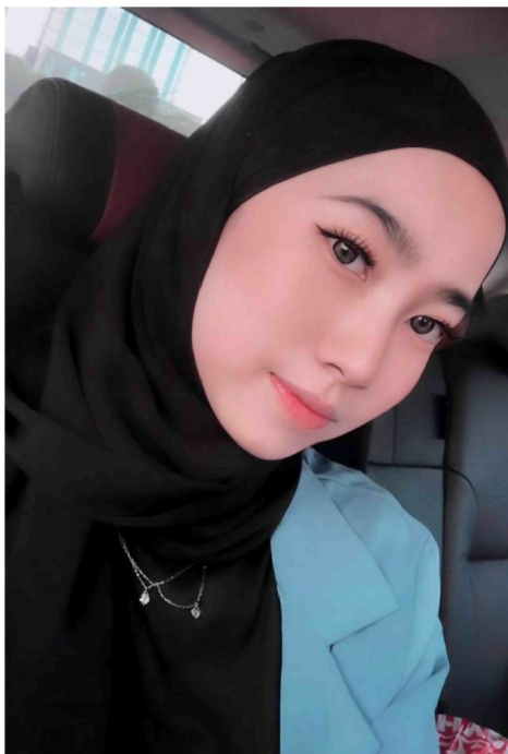
Gambar 2 : Penemubual kedua