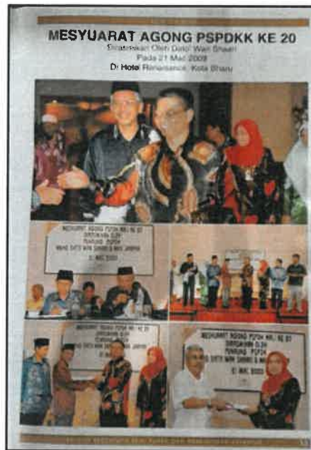
Gambar 6: Laporan media Mesyuarat Agung PSPDKK ke-20