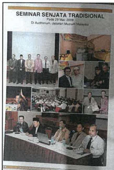
Gambar 7: Laporan media Seminar Senjata Tradisional