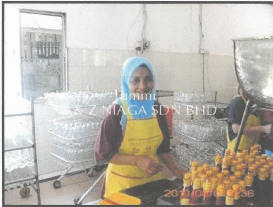
Gambar 1 : Gambar proses pengisian sos pencicah