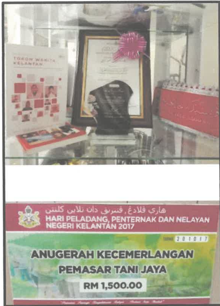
Gambar 6 : Anugerah Kecemerlangan Pemasar Tani Jaya