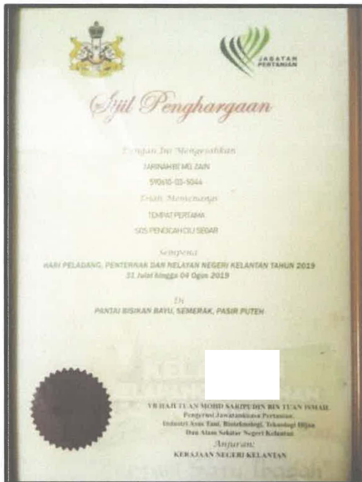
Gambar 7 : Sijil penghargaan sempena Hari Peladang Peternak Dan Nelayan Negeri Kelantan Tahun 2019