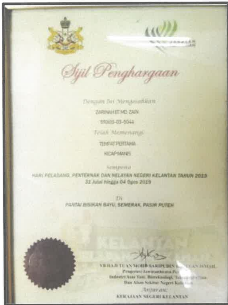
Gambar 9 : Sijil Penghargaan sempena Hari Peladang, Peternak & Nelayan Tahun 2019 31 julai hingga 04 ogos 2019