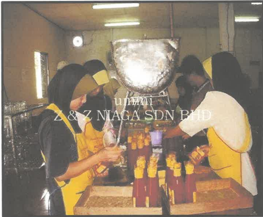
Gambar 3 : Gambar proses pengisian sos pencicah dalam botol