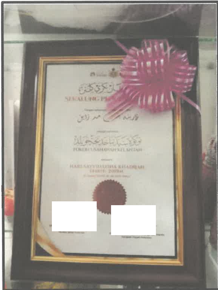
Gambar 5 : Sijil Anugerah Hari Sayyidatina Khadijah