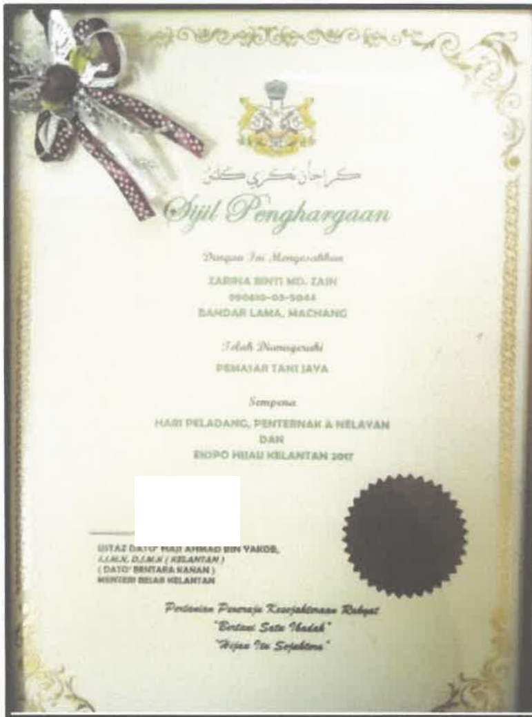
Gambar 8 : Sijil Penghargaan Pemasar Tani Jaya sepena Hari Peladang, Peternak & Nelayan Expo Hijau Kelantan 2017