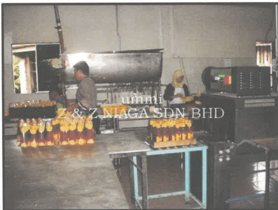
Gambar 4 : Gambar suasana di daalm kilang