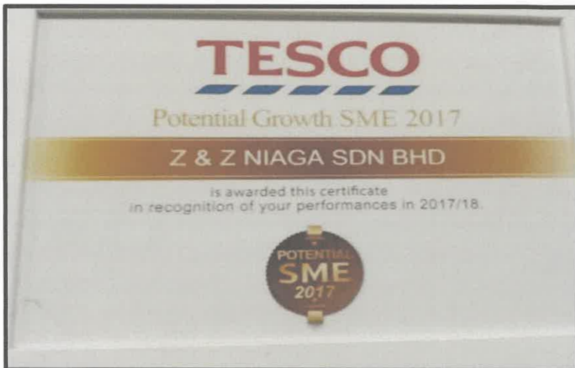
Gambar 4 : Sijil Potential Growth SME 20