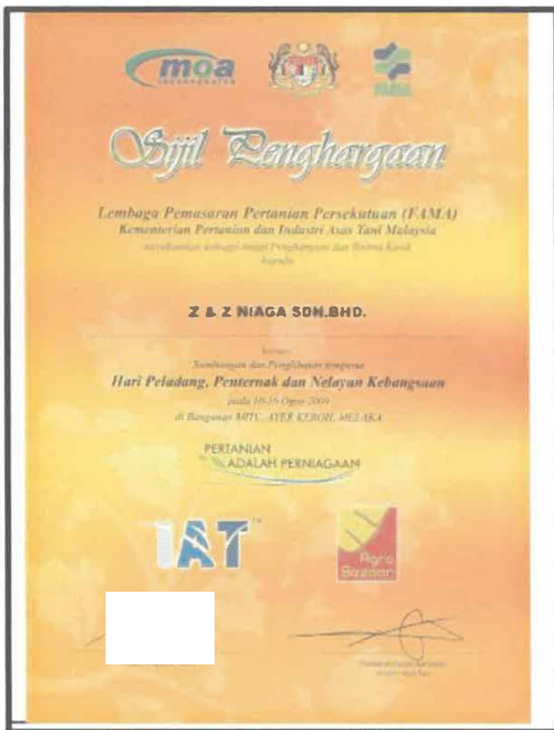
Gambar 2 : Sijil Penghargaan Sumbangan Dan Penglibatan Sempurna Hari Peladang, Peternak dan Nelayan Kebangsaan