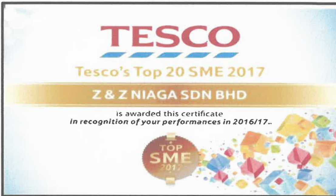
Gambar 3 : Sijil Tesco's Top 20 SME 2017