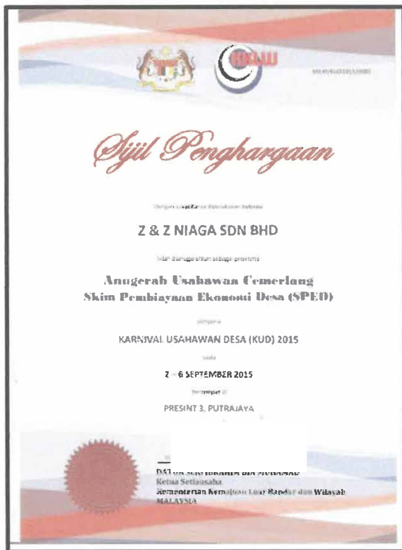
Gambar 1 : Anugerah usahawan Cemerlang Skim Pembiayaan Ekonomi Desa (SPED)