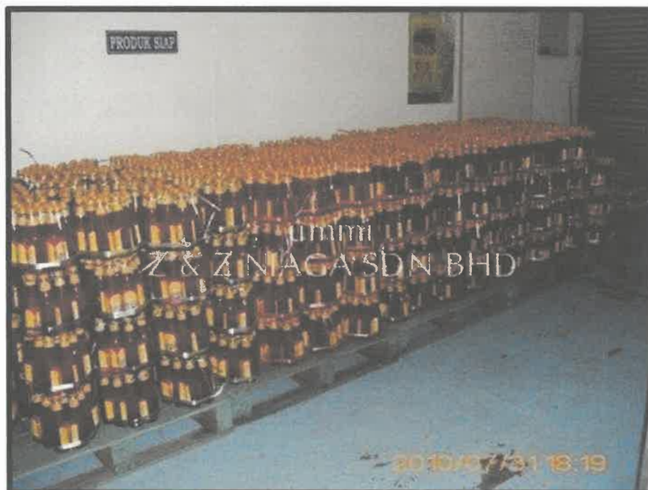
Gambar 2 : Sos pencicah Ummi