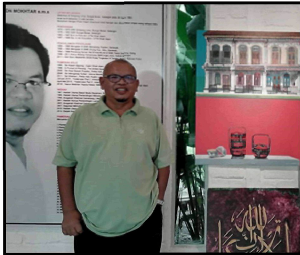
Gambar 1: Merupakan gambar seorang tokoh Warisan Seni Catan iaitu Encik Haron Mokhtar.