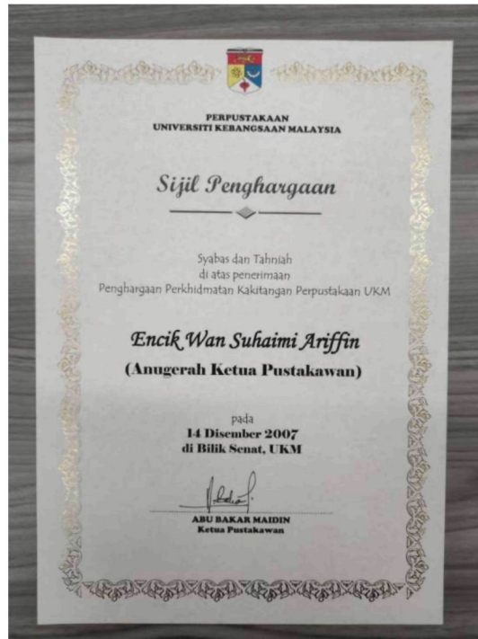
Gambar 11: Sijil anugerah ketua pustakawan