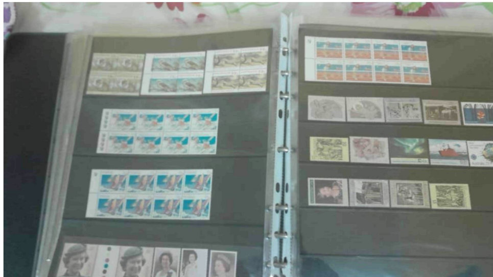
Gambar 7: Sebahagian setem yang dikumpulkan oleh Encik Wan Suhaimi Bin Ariffin