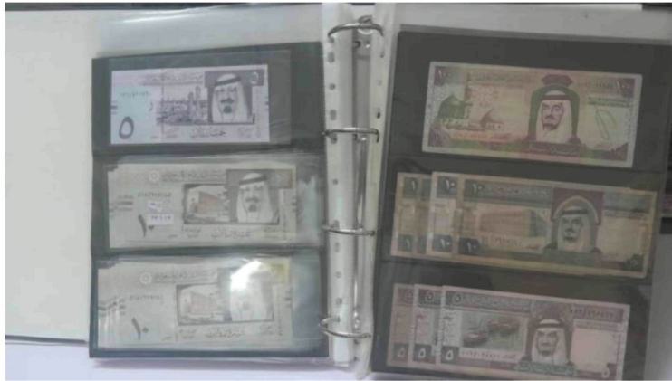
Gambar 6: Sebahagian duit lama yang dikumpulkan oleh En Wan Suhaimi Bin Ariffin