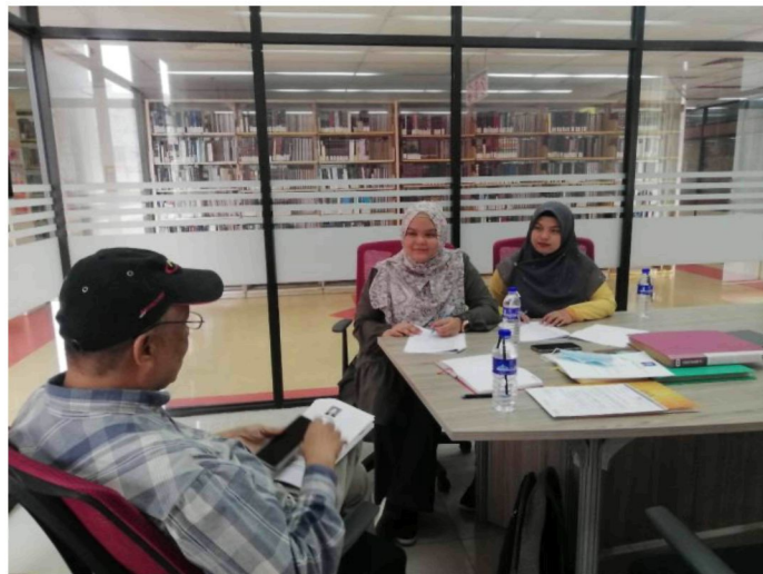
Gambar 5: Semasa sesi temubual bersama tokoh