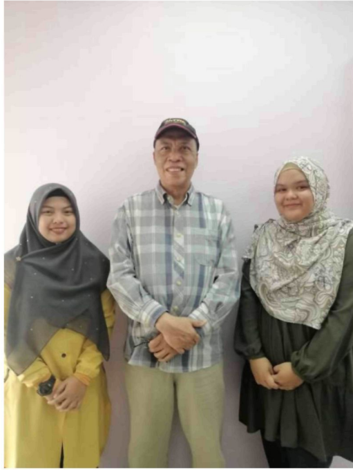
Gambar 4: Sebelum bermulanya sesi temubual