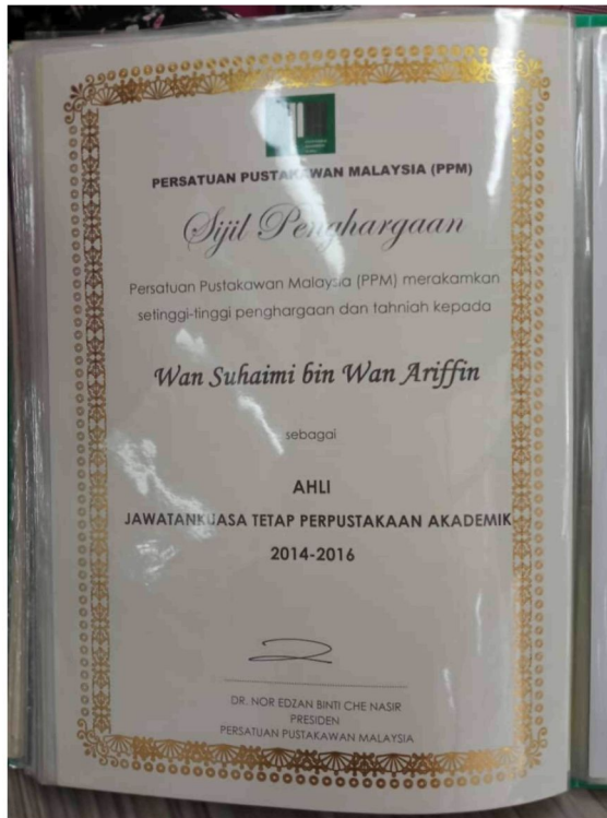
Gambar 13: Sijil penghargaan yang diberikan kepada tokoh