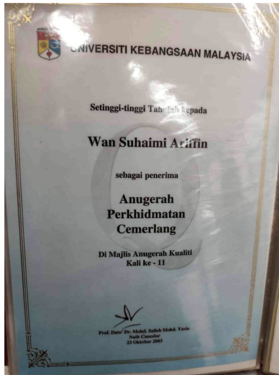
Gambar 9: Sijil Anugerah Perkhidmatan Cemerlang