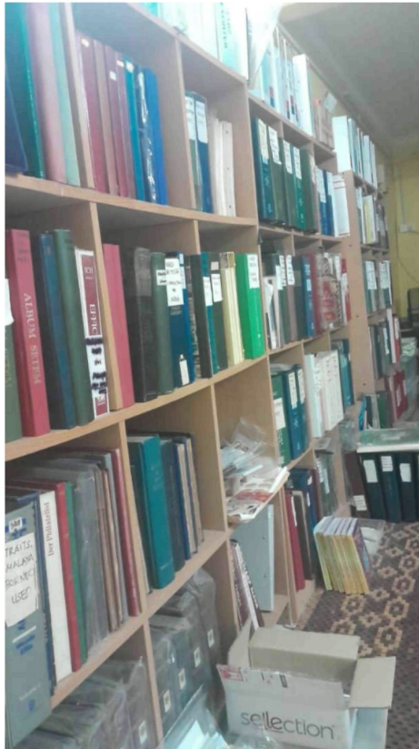
Gambar 8: Koleksi setem di rumah Encik Wan Suhaimi Bin Ariffin