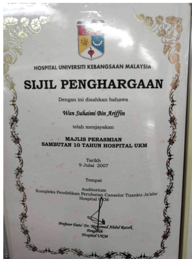
Gambar 10: Sijil perasmian sambutan 10 tahun hospital UKM