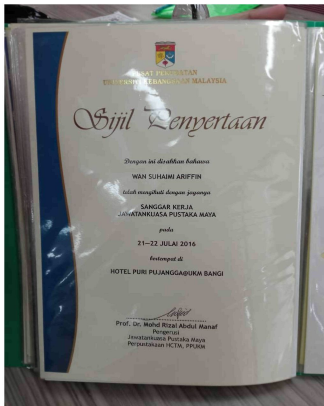
Gambar 14: Sijil penyertaan