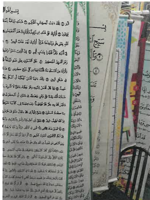
Rajah 4: Gambar karya (bunting) yang dihasilkan di Galeri grafik dan Khat