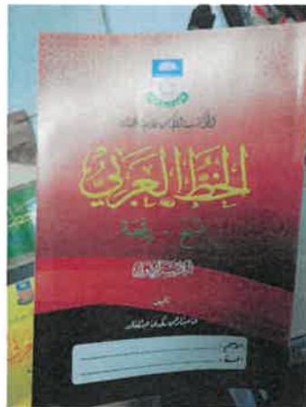
Rajah 5: Gambar buku-buku yang dikeluarkan oleh Ustaz Nik Abdul Rahman Zaki