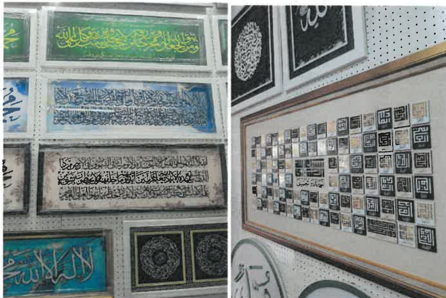
Rajah 5: Gambar hasil-hasil karya tergantung dihasilkan di Galeri grafik dan Khat