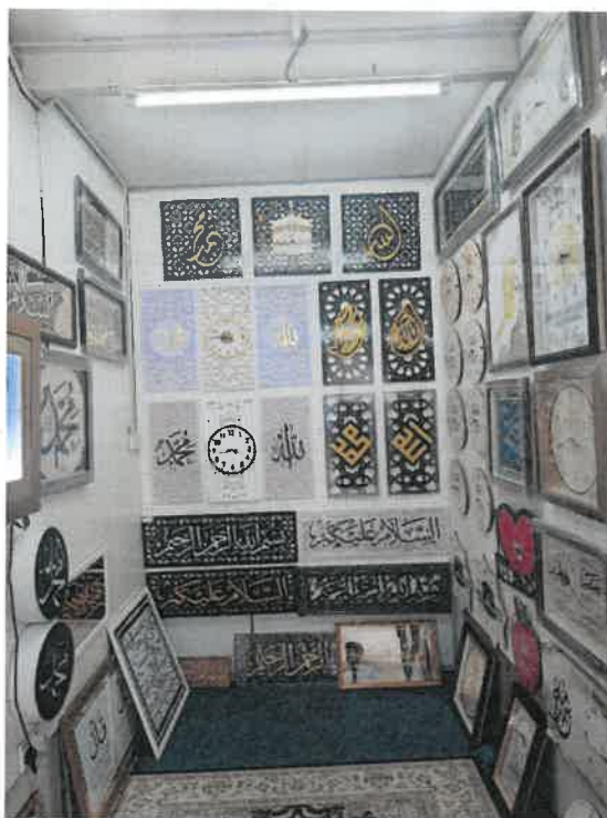
Rajah 4: Gambar ruang hasil karya khat di Galeri grafik dan Khat