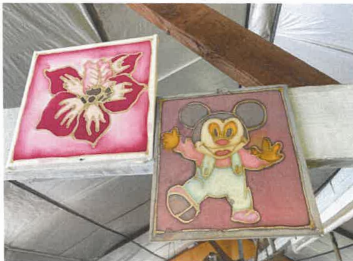
Gambar 4: Batik Kanvas