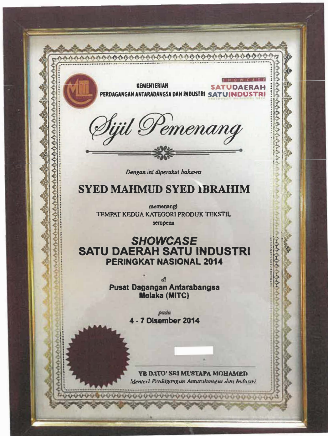
Gambar 9: Sijil Anugerah Pemenang Tempat Ke-2 Kategori Produk Tekstil