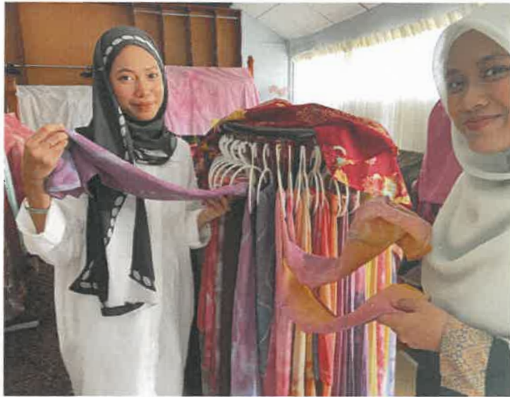
Gambar 3: Koleksi tudung batik