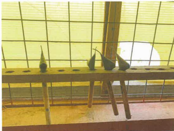
Gambar 6: Alat mencanting batik