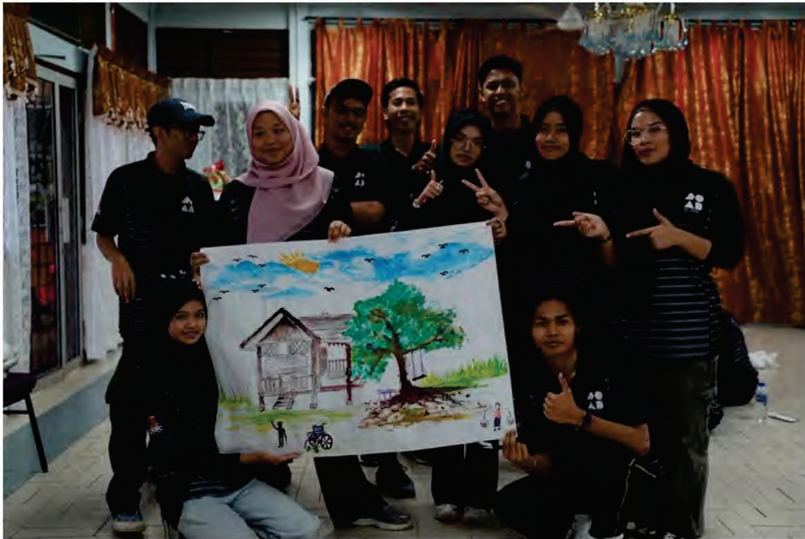
Gambar 3: Pelajar bersama dengan hasil karya seni berkumpul mereka sebelum sesi perkongsian.

Kegembiraan yang ditonjolkan oleh penghuni Rumah Seri Kenangan tidak dapat disembunyikan tatkala pelajar-pelajar datang menziarahi mereka. Ditanya kenapa tersenyum, mereka rata-rata menganggap bahawa lawatan program dari institusi pengajian tinggi itu sedikit sebanyak merawat kerinduan yang terbuku akan ahli keluarga mereka yang sebenar. Begitu juga kepada pelajar yang terlibat, bahkan ada juga yang sangat gembira dapat bermain dan melakukan aktiviti bersama penghuni, seperti bermain bersama atuk dan juga nenek di kampung halaman, sedikit sebanyak membantu mereka mengubati kerinduan.