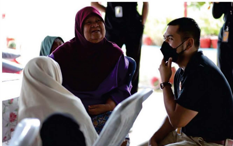
Gambar 1: Pelajar beramah mesra bersama penghuni Rumah Seri Kenangan @ Cheng, Melaka.

Kesihatan adalah salah satu aset tersembunyi di mana setiap orang sering kali terlepas dengan kenikmatan ini. Bily Graham pernah berkata, " When wealth is lost, nothing is lost, when health is lost, something is lost, when character is lost, all is lost ". Kesihatan seperti emas pada setiap manusia untuk dijaga dengan sebaiknya daripada kecil hingga dewasa. Namun, acap kali kita terleka dengan pesanan ini, kesihatan sering dijadikan sebagai kedua