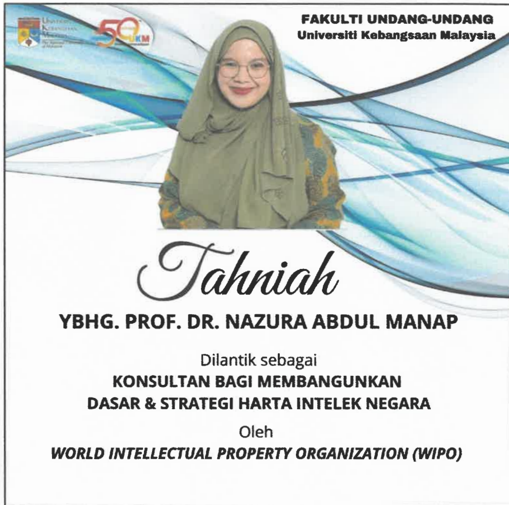
Gambar 1: Perlantikan Konsultan Bagi Membangunkan Dasar Strategi Harta Intelek Negara