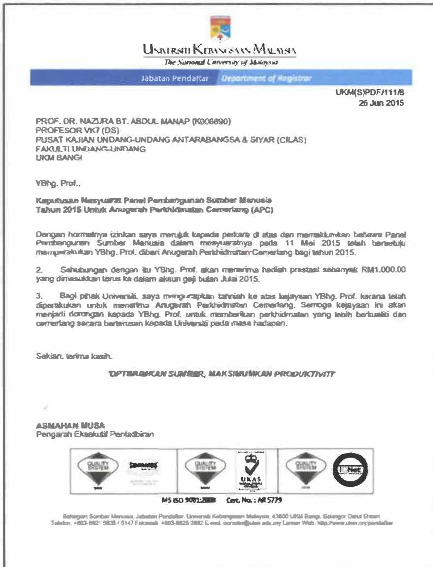
Gambar 5: Keputusan Mesyuarat Anugerah Perkhidmatan Cemerlang 2015