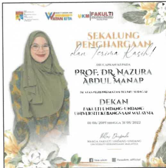
Gambar 3: Penghargaan Atas Perkhidmatan Sebagai Dekan