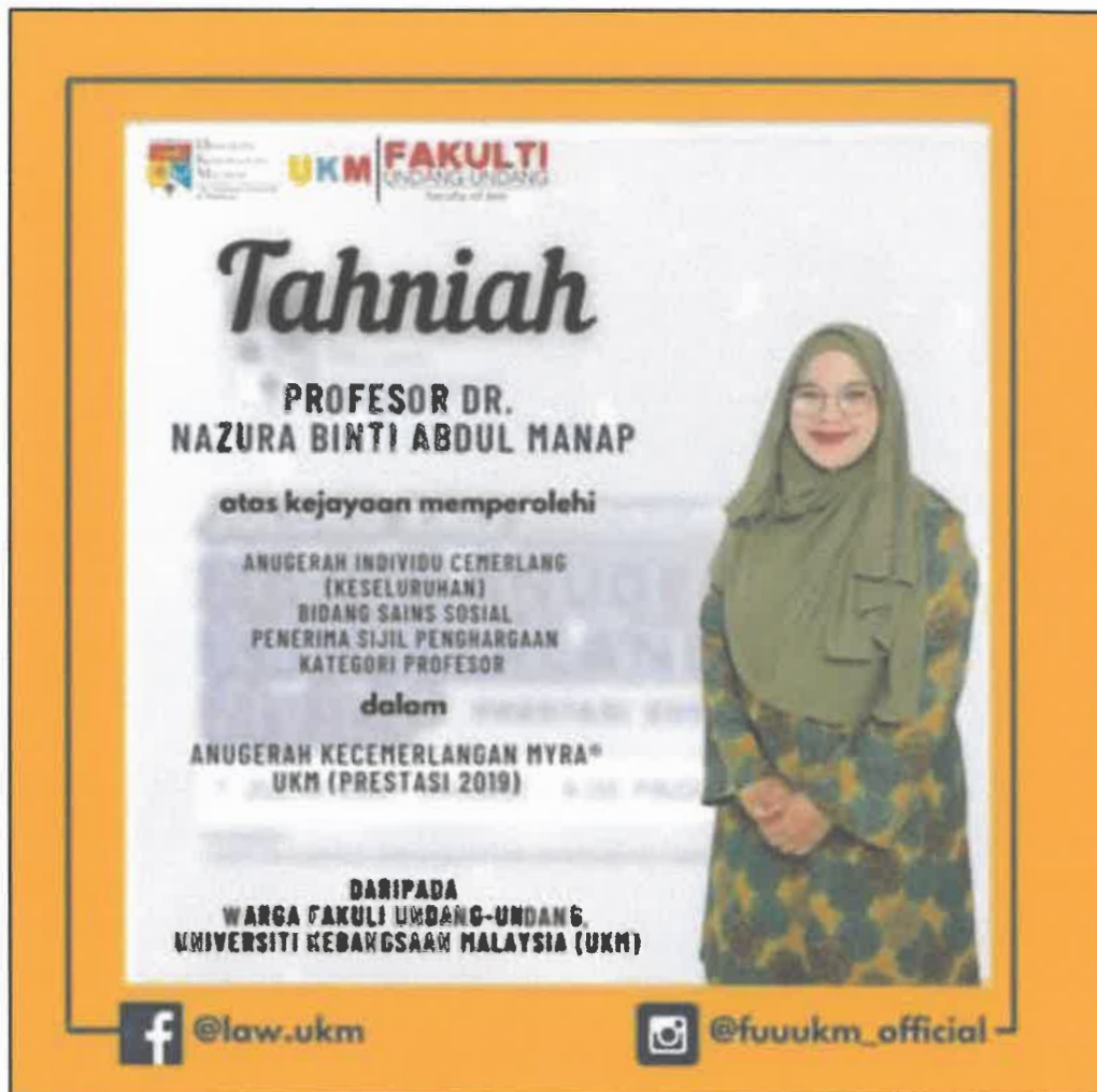
Gambar 2: Anugerah Individu Cemerlang [Keseluruhan] Bidang Sains Sosial & Penerima Sijil Penghargaan Kategori Professor