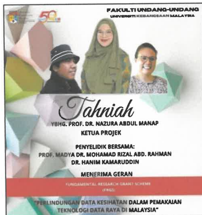
Gambar 4: Anugerah Penerimaan Fundamental Research Grant Scheme (FRGS)