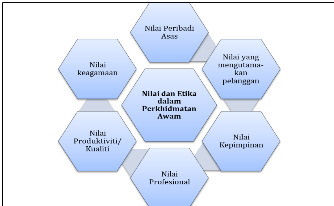
Rajah 2: Nilai dan Etika dalam Perkhidmatan Awam

Justeru di Malaysia, terdapat satu badan institusi yang berfungsi bagi membangunkan modal insan sektor awam yang kompeten melalui pembelajaran berkualiti yang dinamakan Institut Tadbiran Awam Negara (INTAN). Institusi ini telah menyenaraikan beberapa nilai dan etika bagi penjawat awam sebagai panduan bekerja dalam perkhidmatan awam seperti rajah di bawah: