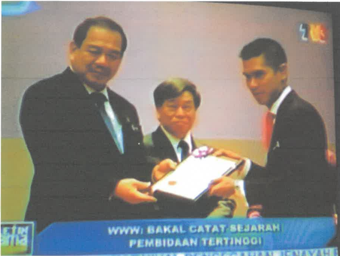
Gambar 1: Mendapat Anugerah Khas Perdana Menteri-Peserta Terbaik Keseluruhan(Cemerlang)