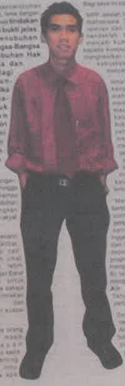
Gambar 2: Ditemuduga oleh pihak penerbitan surat khabar terkemuka di Malaysia