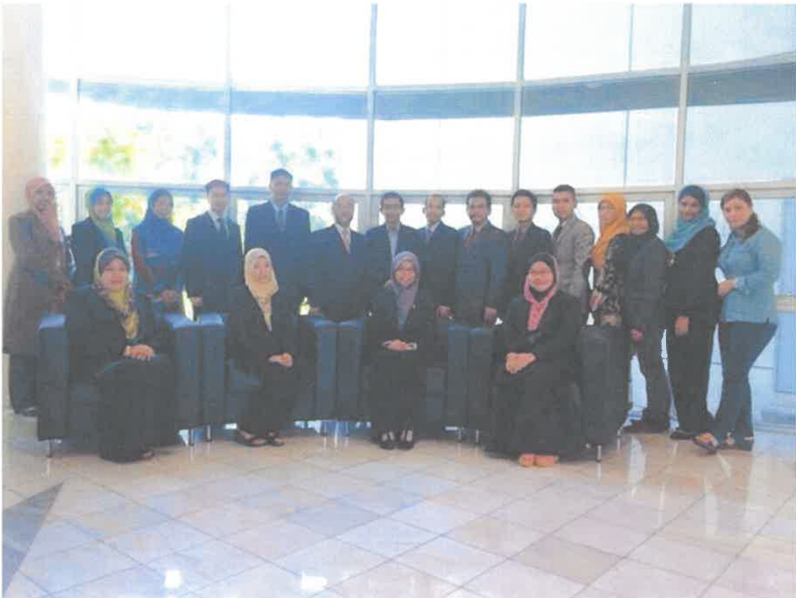
Gambar 4: Peserta Konvensyen Mahasiswa Melayu Kebangsaan