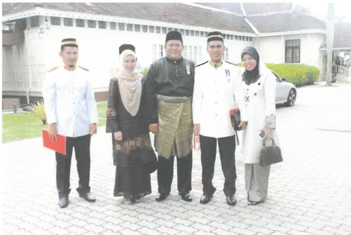
Gambar 3: Dianugerahkan Anugerah Darjah Kebesaran iaitu Ahli Yang Kelima (Ahli) Bagi Darjah Kebesaran Setia Mahkota Kelantan Yang Amat Terbilang (A.S.K)