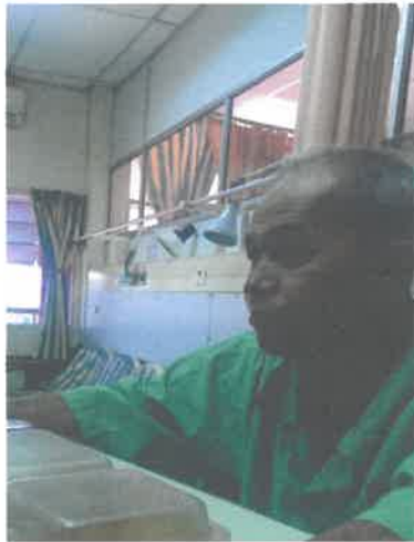
Gambar 1 Gambar Tokoh Sewaktu di Temubual

Penulis membuat kajian luar dengan menggunakan dua cara iaitu melalui temubual dan pemerhatian. Kaedah ini amat penting untuk penulis kerana melalui temubual, penulis dapat memperoleh maklumat tentang pengalaman peribadi tokoh semasa bertugas yang tidak terdapat di mana-mana terbitan sejarah. Penulis juga dapat mengesahkan fakta dan maklumat yg dikumpul melalui medium lain kepada tokoh.