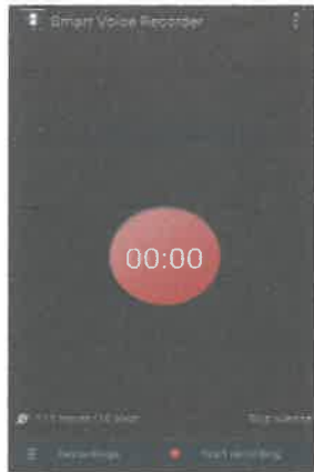
Gambar 2 Perakam Suara

Penulis menggunakan perakam suara melalui telefon bimbit untuk merakam temuramah bersama tokoh tentera iaitu En. Ismail b. Muhamad supaya suara beliau boleh didengar dengan jelas bagi melancarkan lagi proses penulisan kajian dan untuk memastikan penulis tidak tertinggal mana-mana isi temuramah.