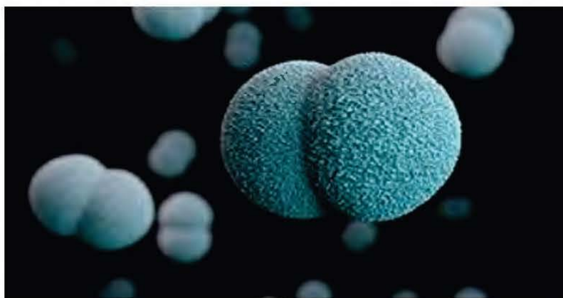
Gambar 2: Bakteria Neisseria meningitidis penyebab penyakit meningokokal meningitis

didiagnos ataupun telah pun dirawat atau telah menyebabkan kematian. Jadi pengenalpastian bakteria penyebab penyakit ini tidak diteruskan. Sukar juga untuk mendapatkan maklumat-maklumat terkini terhadap kes-kes meningitis meningokokal di Malaysia. Sehingga tahun 2020, terdapat hampir 300 kes meningokokal meningitis di Malaysia dengan kes kematian sebanyak 30.