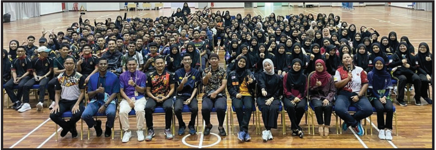
JAWATANKUASA KECIL SEKRETARIAT & SUKARELAWAN KARISMA KALI KE-29, 2024