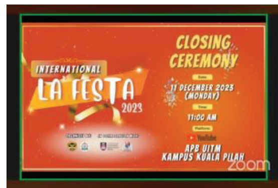
Gambar 4: Majlis Perasmian dan Penutup International La’festa 2023

Program International La’Festa ini diharapkan dapat meningkatkan pengalaman belajar, motivasi dan komunikasi para pelajar universiti serta memberi kesedaran dalam pemahaman pelbagai budaya.