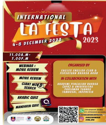
Gambar 1: Poster La' Festa 2023

Buat pertama kalinya, Akademi Pengajian Bahasa dengan kerjasama Kelab Bahasa Inggeris (EAGLES) dan Persatuan Bahasa Arab UiTM Kampus Kuala Pilah telah menganjurkan program Festival Bahasa di peringkat antarabangsa iaitu International La'Festa 2023 pada 4 sehingga 11 Disember 2023. Program ini merupakan kesinambungan dari program Festival Bahasa sebelum ini yang diadakan pada setiap semester di peringkat kampus. International La'Festa 2023 ini memfokuskan kepada budaya penggunaan dan pengetahuan bahasa dalam kalangan pelajar di peringkat antarabangsa. Universitas Pahlawan Tuanku Tambusai, Indonesia merupakan universiti jemputan kami untuk turut serta dalam menjayakan program ini. Pelbagai aktiviti dan pertandingan bahasa telah dianjurkan.