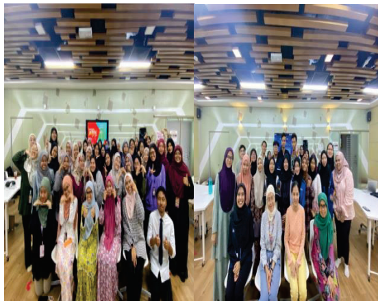
Gambar 3: Para peserta bagi pertandingan Arabic Quizizz dan Mandarin Quizizz

Program ini telah mendapat sambutan yang memberangsangkan. Seramai 119 orang peserta telah menyertai International La’Festa 2023 yang terdiri daripada mahasiwa dan mahasiswi UiTM Kampus Kuala Pilah Cawangan Negeri Sembilan dan juga Universitas Pahlawan Tuanku Tambusai, Indonesia. Pemenang bagi setiap pertandingan telah diberikan hadiah berbentuk wang tunai. Intihannya, program ini telah menyemarakkan lagi semangat pelajar untuk terus mengasah kemampuan diri serta berupaya menilai keupayaan serta potensi pelajar menggunakan bahasa Inggeris dan bahasa ketiga (bahasa Arab dan bahasa Mandarin) sebagai bahasa komunikasi, dan bahasa ilmu. Hal ini secara tidak langsung berupaya menghasilkan pelajar yang berkualiti dalam aspek penguasaan bahasa dan komunikasi setaraf mahasiswa dan mahasiswi di peringkat antarabangsa.