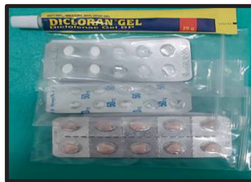
Gambar 2: Ubatan yang diperolehi daripada farmasi klinik

tempoh seminggu kesakitan ini tidak juga berkurangan, beliau meminta saya datang semula bertemunya untuk diberikan rawatan fisioterapi. Doktor juga memberikan cuti sakit untuk saya berehat meredakan kesakitan. Bagaimanapun untuk mengelakkan gangguan kepada kelancaran kuliah kepada pelajar-pelajar, saya tetap meneruskan kuliah di rumah secara dalam talian mengikut jadual kelas yang ditetapkan.