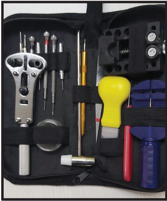
Gambar 2: Peralatan membaiki jam tangan yang dibeli di Shopee

berjaya menukar bateri dan membaiki kerosakan jam tangan mereka dengan tangan saya sendiri ialah sebagai suatu upah yang tidak ternilai harganya.