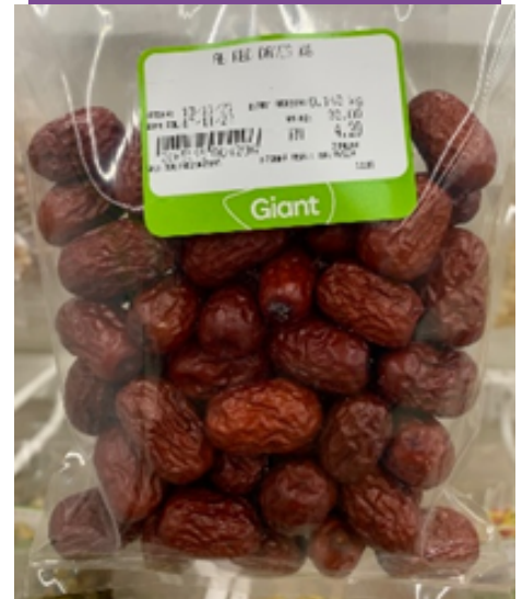
Contoh kurma merah yang diperolehi dari pasar besar tempatan. Spesis ini berbeza dengan buah kurma atau tamar yang diperolehi dari negara.