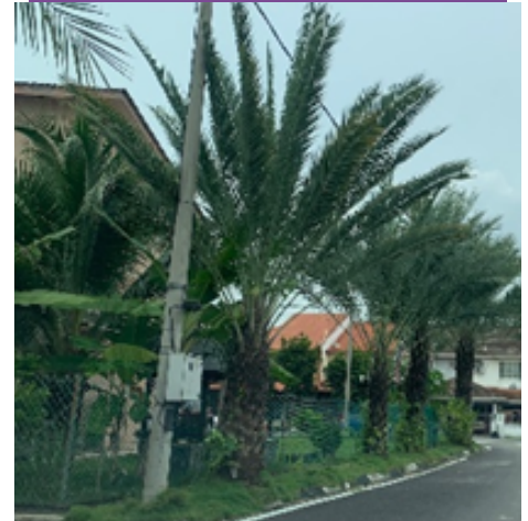
Kelihatan deretan pokok kurma yang dijadikan tanaman penghias jalan raya di bandar Klang, Selangor Darul Ehsan.

Dalam farmasi komuniti, terdapat contoh produk makanan yang menggabungkan jus pekat kurma atau buah tamar ini (spesis pokok Phoenix) dengan ekstrak kurma merah China (buah jujuba atau pokok Zizipus). Kandungan gula asli dalam kedua-dua kurma ini, serta campuran madu, menyebabkan produk sebegini kaya dengan asid amino semulajadi. Ia mampu meningkatkan pengaliran darah serta menceriakan penampakan wajah wanita yang mengambil produk kecantikan ini. Namun, ia perlu diambil dengan kadar yang dinasihati oleh ahli pemakanan serta pegawai farmasi, agar pengguna turut berjaga-jaga dengan pengambilan gula seharian, supaya gula tambahan ini tidak menyebabkan kadar gula di dalam darah menjadi tinggi. Melalui teknik pembungkusan serta teknologi moden, penghasilan produk kurma dalam bentuk paket atau kepingan kecil (sachet), dipasarkan agar pengguna mudah membawanya di dalam poket serta memakannya pada sebarang waktu.