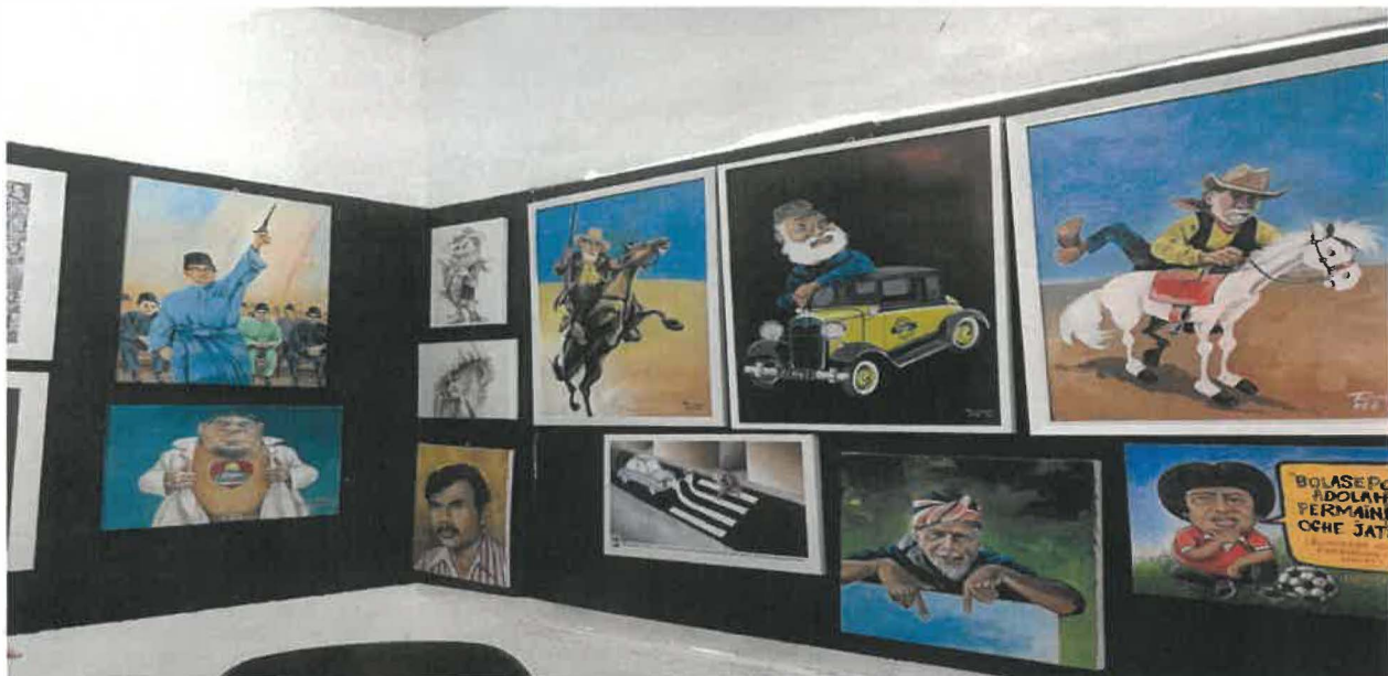
Gambar 8: Hasil Karya Pak Rossem.