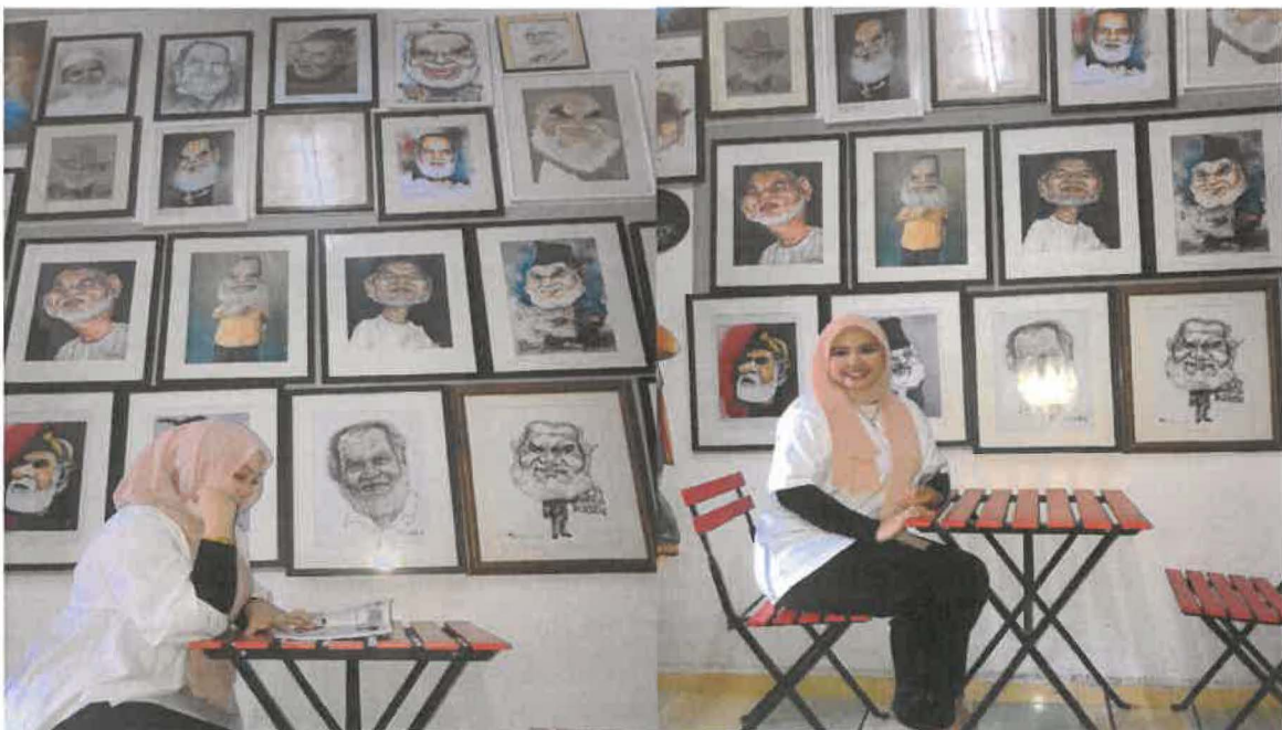
Gambar 4: Karya-karya karikatur Pak Rossem,