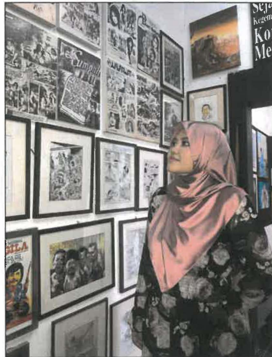
Gambar 6: Karya-karya Pak Rossem.