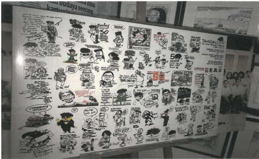
Gambar 7: Lukisan-lukisan daripada rakan-rakan tokoh, Pak Rossem.