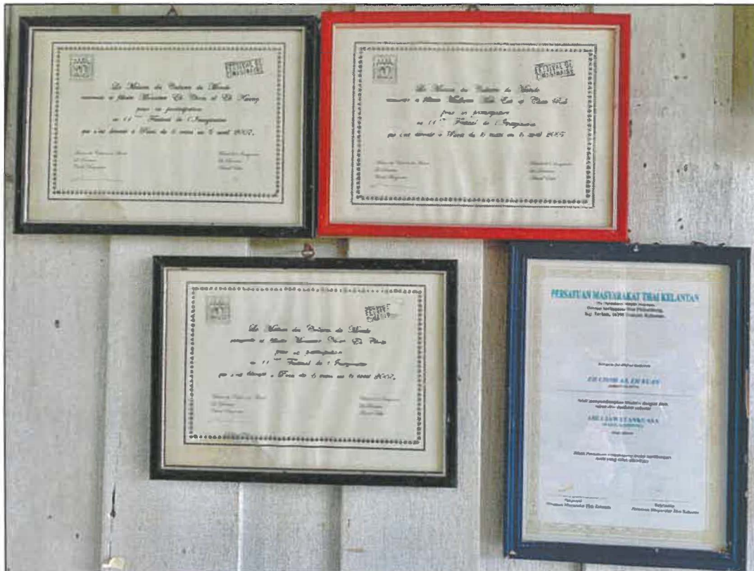
Gambar 5: Sijil-sijil yang diperoleh oleh Puan Mek Eek sepanjang penglibatannya dalam seni tari Menora