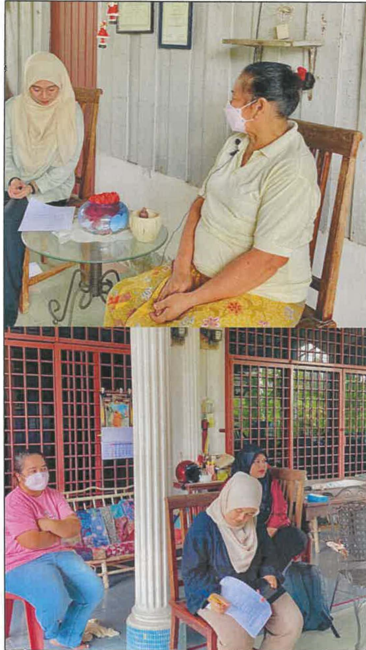
Gambar 4: Disebalik tabir temu bual bersama puan Mek Eek