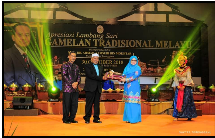
Gambar 12: Anugerah Tokoh Gamelan Melayu Terengganu Pada Oktober 2018