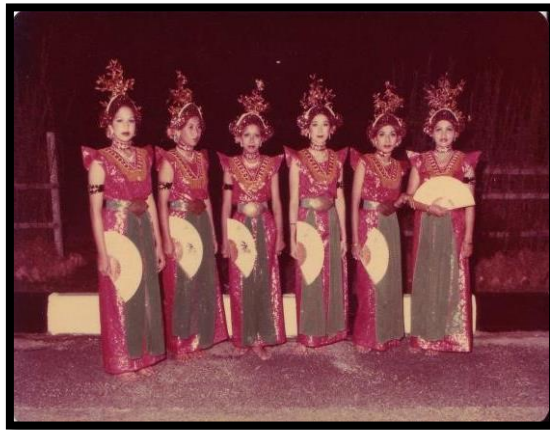
Gambar 4: Persembahan Tarian Gamelan di Istana Maziah, Kuala Terengganu sempena Hari Ulangtahun Keputeraan DYMM Sultan Terengganu pada tahun 1970-an.