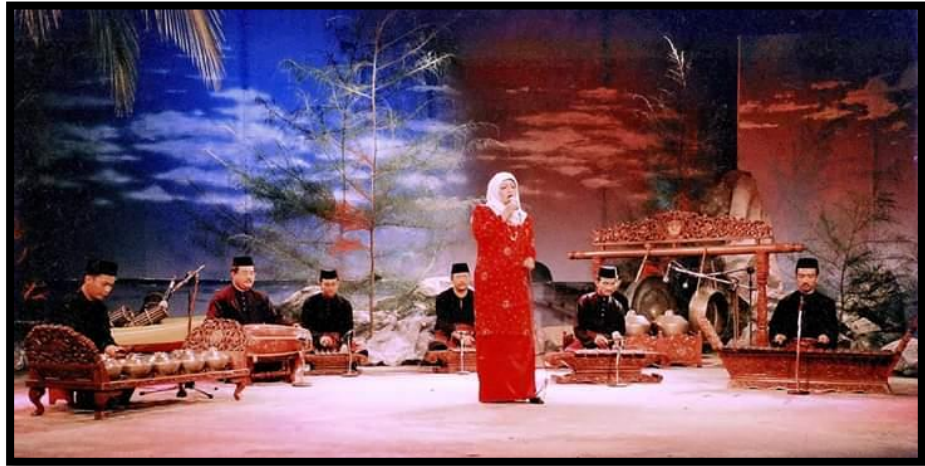
Gambar 7: Sesi Rakaman Lagu Gamelan untuk Program Salam Pantai Timor Terbitan RTM