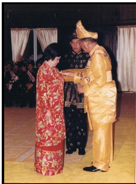
Gambar 11: Anugerah Ahli Mahkota Terengganu (AMT) 1992 - Oleh Ke Bawah DYMM Sultan Terengganu