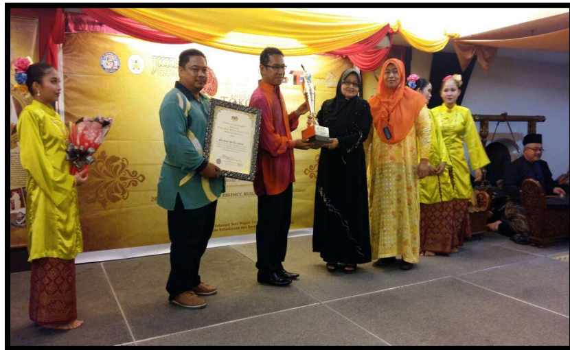
Gambar 13: Anugerah Tokoh Seni & Budaya Negeri Terengganu –Oleh Jabatan Kebudayaan & Kesenian Negara, Terengganu pada tahun 2016