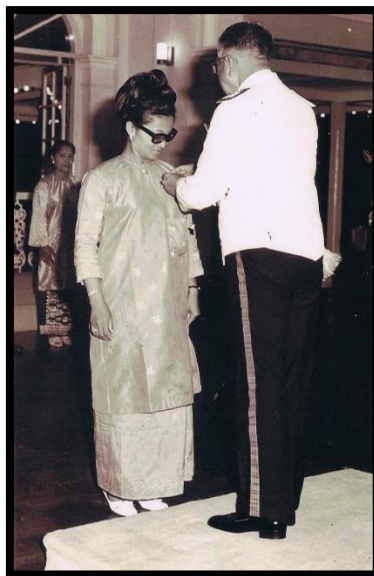
Gambar 9: Anugerah Pingat Jasa Kebaktian (PJK) 1972 - Oleh Ke bawah DYMM Sultan Terengganu