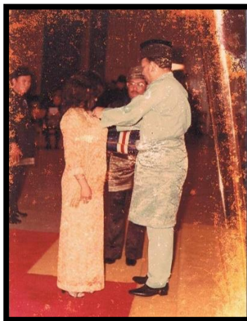
Gambar 10: Anugerah Pingat Pangkuan Negara (PPN) 1979 - Oleh Ke bawah DYMM Timbalan Yg Di Pertuan Agong