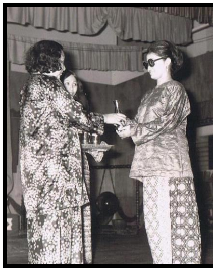
Gambar 6: Anugerah Pelakon Wanita Terbaik 1972 yang disampaikan oleh Isteri YB Setiausaha Kerajaan Terengganu