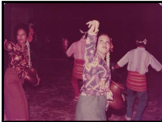
Gambar 5: Pertandingan tarian di Johor Bahru sempena Pesta Sukan dan Kebudayaan Perkhidmatan Pendidikan Malaysia, 1978. (Johan)