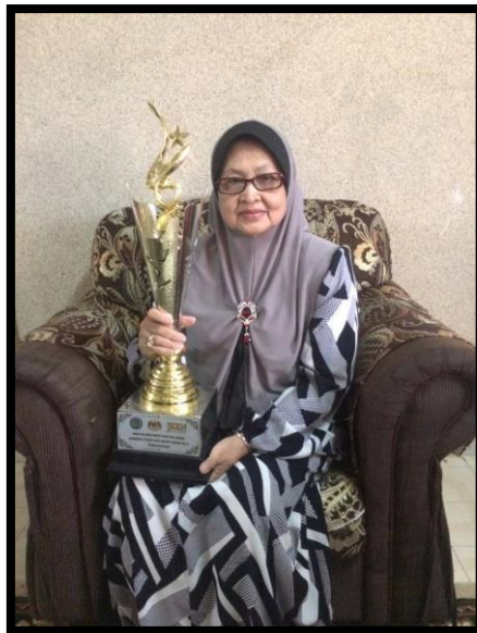
Gambar 1: Tokoh Seni Budaya Wan Salmah Wan Sulaiman

Wan Salmah Wan Sulaiman merupakan penyanyi asal lagu rakyat iaitu Ulek Mayang. Beliau dilahirkan pada 16 September 1944 dan merupakan anak kelahiran Kampung Tiong, Kuala Terengganu. Beliau merupakan seorang penggiat seni yang masih aktif dalam pelbagai bidang seni budaya sehingga sekarang. Sebagai tanda penghargaan di atas jasa beliau dalam memartabatkan bidang seni budaya, beliau dianugerahkan sebagai Tokoh Seni Budaya Negeri Terengganu pada tahun 2016.