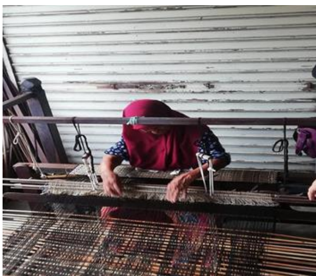
Gambar 7: Penenun songket menggunakan alat tenun tradisional

Kajian ini juga telah mengkaji cara-cara penyimpanan dan penjagaan songket dengan betul. Penyimpanan bagi kain songket ini amat penting bagi mengekalkan keadaan fizikal songket agar kelihatan seperti baru. Mohammad bin Haji Hussein juga ada menambah bahawa penjagaan songket ini penting dan perlu diketahui bagi penggemar dan pembeli kain songket. Cara penyimpanan dan penjagaan yang betul ialah dengan menggulungkan kain songket tersebut dengan menggunakan kayu ataupun menyangkut kain songket tersebut menggunakan penyangkut baju bagi mengelakkan kain songket itu berlipat. Untuk memelihara keunggulan dan kecantikannya, kain songket seharusnya dibasuh dengan menggunakan teknik cucian kering. Untuk menyeterika kain tersebut, ianya mestilah dilakukan dengan meletakkan kain alas ataupun kain sarung di atas kain songket tersebut bagi mengelakkan kain songket tersebut terbakar semasa sedang seterika.