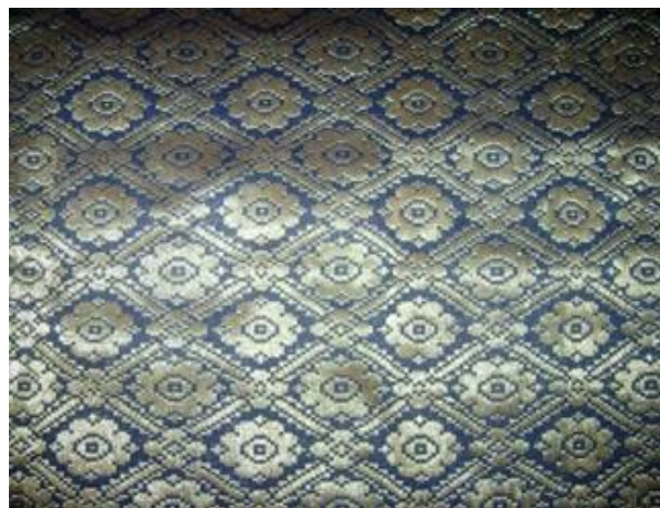
Gambar 4: Corak Songket Tapak Catur

Corak dan motif tersebut digunakan sejak turun-temurun sehinggalah sekarang. Corak yang biasanya digunakan pada kain tenun ini ialah Songket Jalur Melintang iaitu coraknya yang disusun mengikut jalur melintang. Manakala, Songket Bunga Bertabur pula, bunganya yang disusun secara tidak teratur dan tidak terikat atau berangkai antara satu sama lain. Selain itu, corak Songket Pucuk Rebung biasanya terdapat pada bahagian kepala kain, dan pada kaki atau tepi kain songket. Motif pucuk rebung juga dikenali sebagai motif tumpal dan berbentuk tiga segi. Seterusnya, corak Songket Bunga Penuh ialah bunga yang penuh dan mengandungi beberapa jenis motif untuk memenuhi tanah kain. Ada yang berbentuk rantaian dan dikenali sebagai teluk berantai.