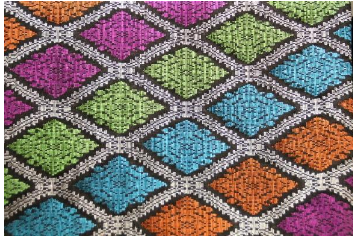
Gambar 5: Contoh songket bermotif Rhombus dan juga Ladu

Hussein berpendapat bahawa bentuk rhombus dan ladu adalah corak yang paling banyak digunakan pada kain songket iaitu segi empat yang berbentuk seperti ketupat.