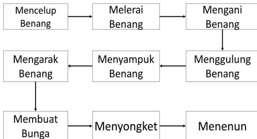
Gambar rajah 1: Proses penghasilan Songket

Melalui daripada hasil kajian ini, masyarakat dapat mengetahui cara-cara dan proses dalam menghasilkan sehelai kain songket. Rajah 1 menunjukkan proses keseluruhan penghasilan sehelai kain songket dengan lengkap. Ianya dimulai dengan mencelup benang dengan beberapa jenis warna. Seterusnya, kerja melerai benang dari lembaran agar benang terurai supaya senang untuk dimasukkan ke dalam Cuban. Setelah benang dilarai, benang tersebut akan dialami ataupun disebut sebagai proses mengani benang kepada kek dan diikuti dengan proses menyampuk benang.