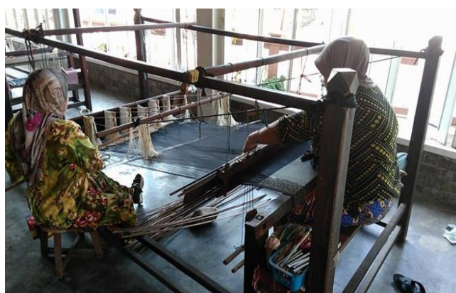
Gambar 1: Proses Melerai Benang

Melalui daripada hasil kajian ini, masyarakat dapat mengetahui cara-cara dan proses dalam menghasilkan sehelai kain songket. Rajah 1 menunjukkan proses keseluruhan penghasilan sehelai kain songket dengan lengkap. Ianya dimulai dengan mencelup benang dengan beberapa jenis warna. Seterusnya, kerja melerai benang dari lembaran agar benang terurai supaya senang untuk dimasukkan ke dalam Cuban. Setelah benang dilarai, benang tersebut akan dialami ataupun disebut sebagai proses mengani benang kepada kek dan diikuti dengan proses menyampuk benang.