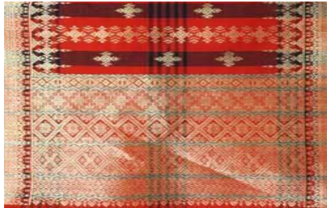
Gambar 3: Corak Songket Jalur Melintang

motif songket yang beliau hasilkan adalah mengikut corak yang telah direka oleh ibunya sejak dari dulu lagi.