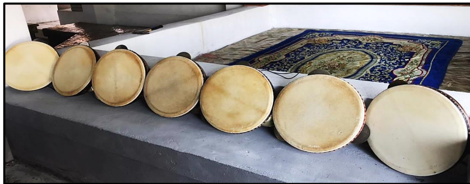
Gambar 1: Kompang Rodat

Ciri-ciri pemain juga boleh dipengaruhi oleh minat terhadap bidang tersebut. Minat boleh dipengaruhi oleh persepsi seseorang terhadap sesuatu perkara yang pernah dilihat dan seterusnya mendorong untuk melakukan perkara tersebut. Menurut Polak (1976), minat didorong oleh perasaan ingin tahu terhadap sesuatu perkara yang dilihat atau dirasa. Menurut Dasuki (2020), minat masyarakat dulu untuk bermain Kompang Rodat adalah melalui hobi untuk mengisi masa lapang pada ketika itu. Menurut Walgito (1981), minat merupakan suatu keadaan apabila seseorang itu memberikan perhatiannya terhadap sesuatu benda atau situasi dan disertai dengan keinginan untuk mempelajari atau mengetahui lebih lanjut.