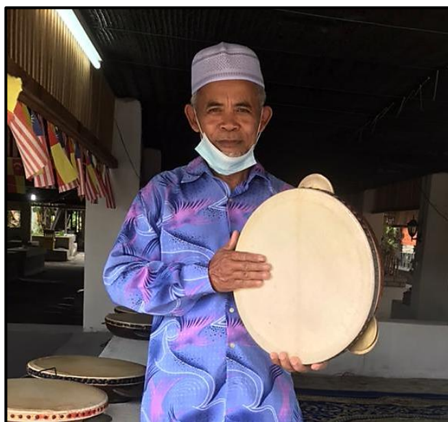
Gambar 2: Contoh teknik memegang Kompang