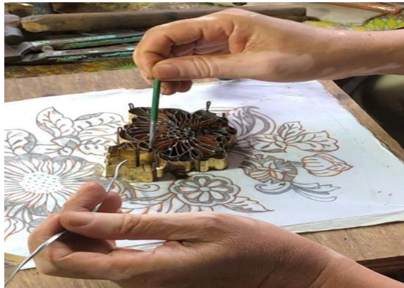
Gambar 6: Teknik lenturan tembaga blok batik

Setelah lakaran yang dihasilkan dan dipersetujui atau muktamad, proses seterusnya bermula dengan melentur kepingan tembaga mengikut corak yang telah dilakukan. Kepingan tembaga yang dilenturkan dipakukan supaya ia tidak bergerak dan kekal pada corak lakaran. Sila rujuk gambar dibawah: