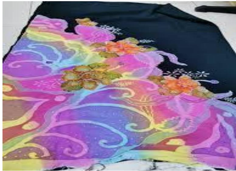
Gambar 5: Contoh Batik Pelangi

Jenis batik seterusnya adalah Batik Skrin yang berasal dari negara Thailand. Jika dilihat kepada corak motif kedua-dua jenis batik ini mempunyai persamaan yang jelas, namun yang membezakan antara kedua-dua jenis batik ini adalah penggunaan lilin pada proses cantingan batik. Menurut responden kajian, beliau menyatakan antara produk tekstil batik yang menggunakan konsep Batik Skrin adalah batik sarung yang dikatakan lebih popular kerana pengeluarannya yang lebih cepat dalam sesuatu masa berbanding dengan Batik Blok.