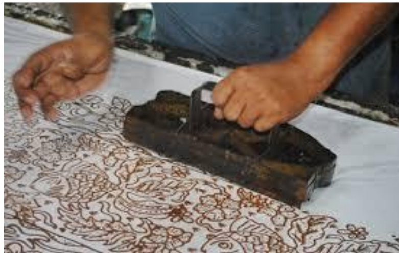
Gambar 2: Cap menerap blok batik

Seni warisan Batik merupakan salah satu seni halus yang disegani di Malaysia, ini adalah kerana nilai eksklusif pada setiap produk Batik yang unik dan mampu menarik mata yang memandang dan seri kepada pemakainya. Batik yang terdapat di negara ini terdiri daripada pelbagai jenis antaranya Blok Batik, Batik Canting, Batik Skrin dan Batik Pelangi. Jenis-jenis batik ini berbeza diantara satu sama lain kerana cara pembuatan dan penghasilannya yang unik mengikut jenis masing-masing.