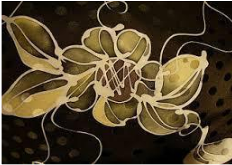
Gambar 3: Contoh corak pada batik canting

Batik canting atau tulis ianya diperbuat daripada pelbagai jenis kain seperti voile, sutera dan kapas. Kebiasaanya motif dilukis adalah ilham daripada kepelbagaian sumber alam serta bermotifkan corak geometri. Batik lukis dihasilkan dengan menggunakan bekas yang kecil atau dikenali dengan nama canting iaitu bekas yang mempunyai saluran muncung halus bagi menakung lilin dengan tujuan untuk memblok warna.