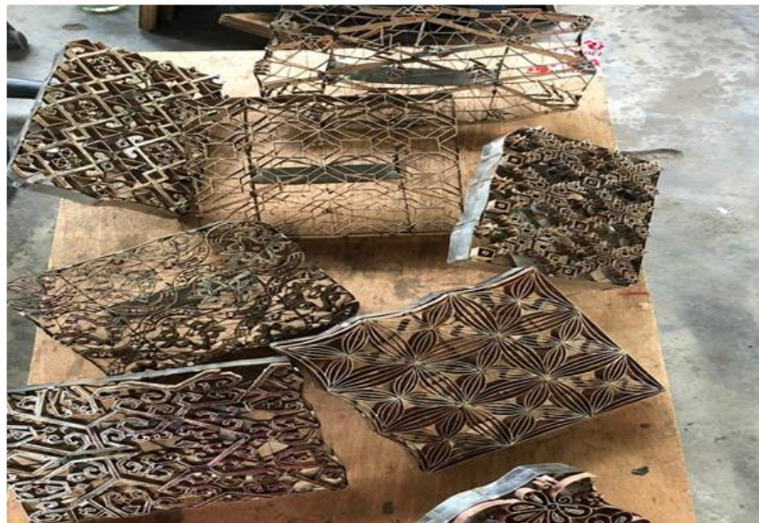
Gambar 1: Jenis-jenis blok batik

Secara amnya, Blok Batik adalah sebuah alatan pengukiran corak batik yang melibatkan kaedah pembuatannya yang terdiri daripada proses pengukiran corak pada bongkah kayu mahupun pelbagai instrumen yang dipilih seperti batang pisang dan ubi kentang dengan ukiran timbul. Ukiran yang telah siap akan dicelup dan ditekup pada permukaan kain. Maka hasil daripada proses ini diberi nama Batik Blok.