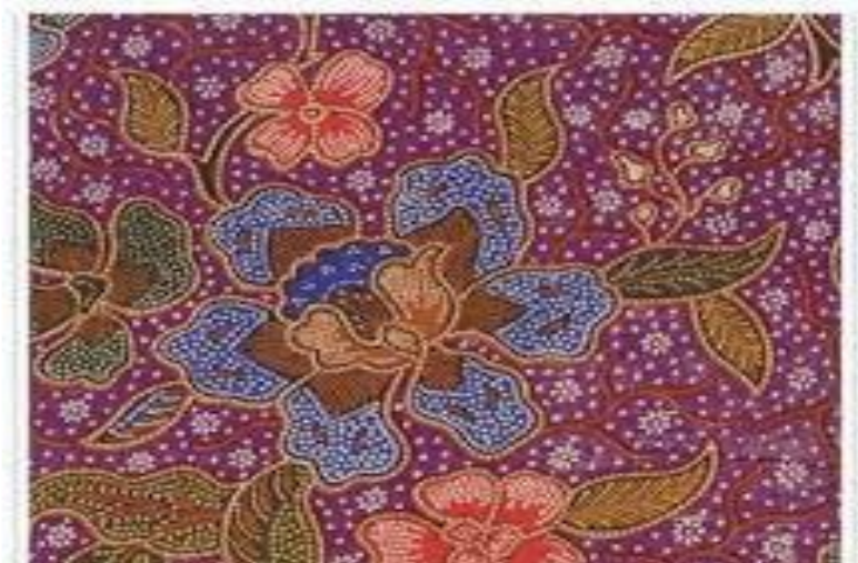
Gambar 4: Contoh Batik Skrin

Batik canting atau tulis ianya diperbuat daripada pelbagai jenis kain seperti voile, sutera dan kapas. Kebiasaanya motif dilukis adalah ilham daripada kepelbagaian sumber alam serta bermotifkan corak geometri. Batik lukis dihasilkan dengan menggunakan bekas yang kecil atau dikenali dengan nama canting iaitu bekas yang mempunyai saluran muncung halus bagi menakung lilin dengan tujuan untuk memblok warna.