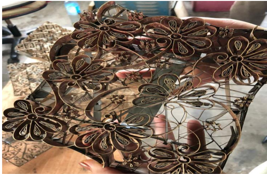
Gambar 7: Blok motif organik