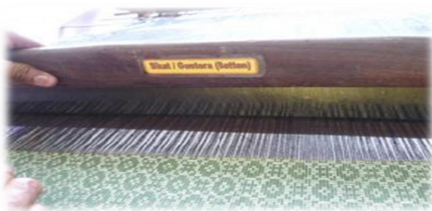
Gambar 6: Merupakan proses kelima iaitu menyampuk.