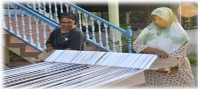
Gambar 5: Merupakan proses keempat iaitu menggulung.