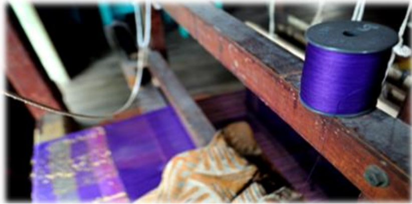
Gambar 7: Merupakan proses yang keenam iaitu proses menghubungkan.