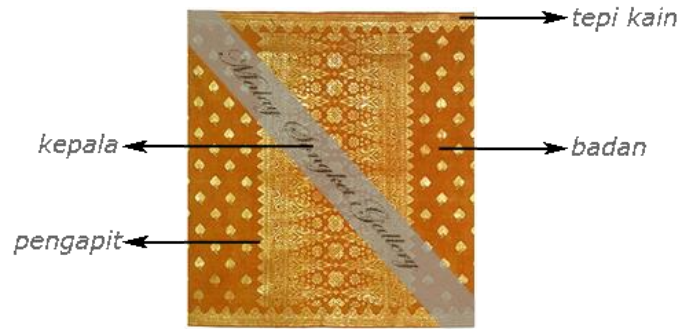
Gambar 1: Menunjukkan bahagian kain sarung songket