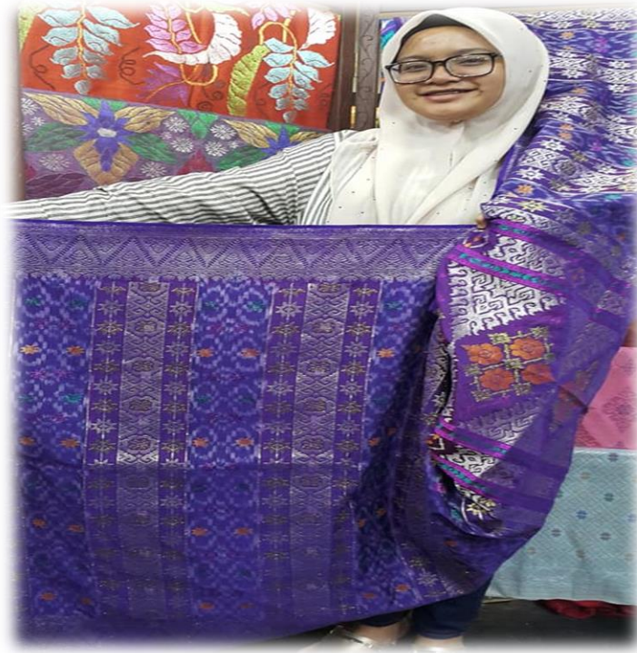
Gambar 10: Menunjukkan songket Terengganu yang sudah siap ditenun.