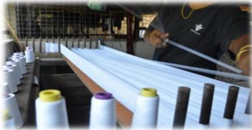
Gambar 4: Menunjukkan proses ketiga iaitu menganing.