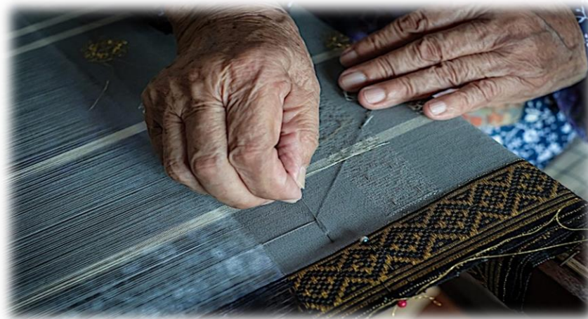
Gambar 9: Menunjukkan proses yang terakhir iaitu proses menenun.