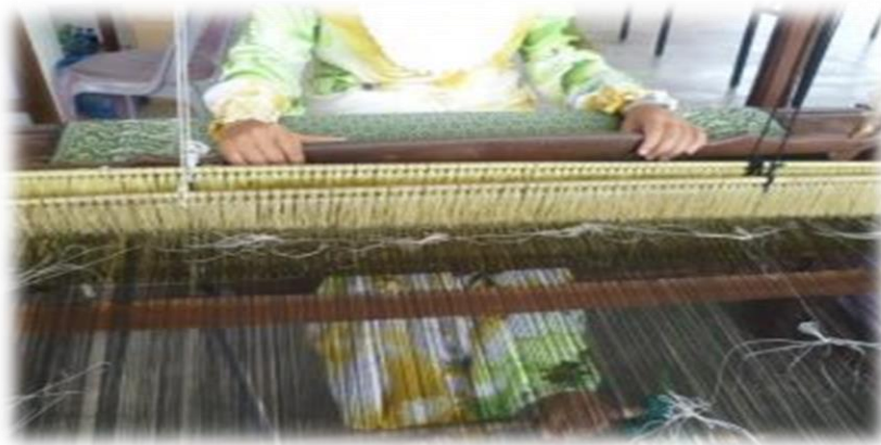
Gambar 8: Menunjukkan proses ketujuh iaitu menyolek.