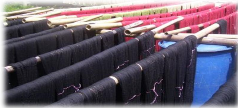
Gambar 2: Merupakan proses pertama dalam teknik pembuatan songket iaitu mewarna.