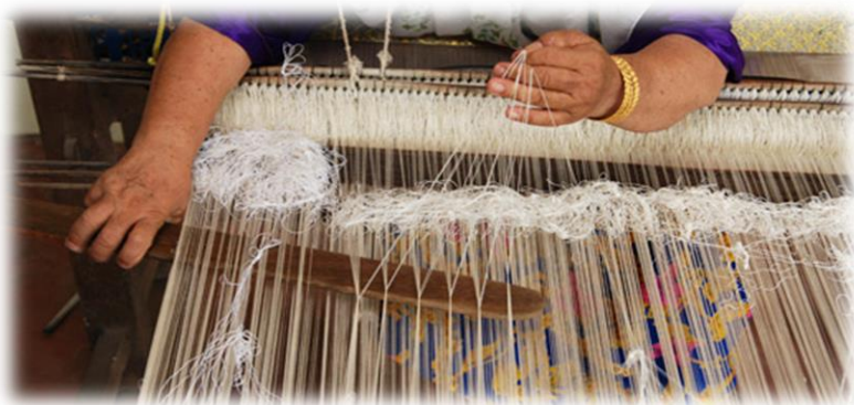
Gambar 3: Merupakan proses kedua iaitu melerai.