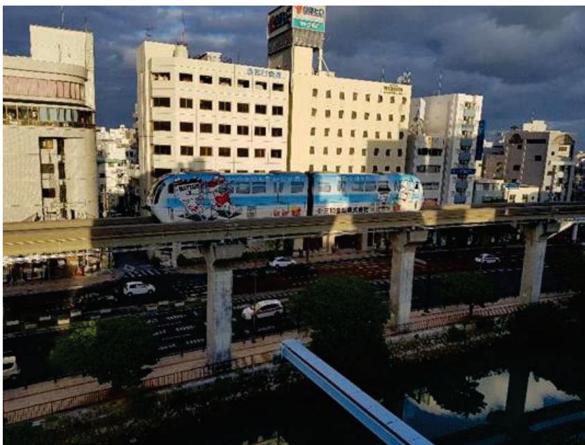
Gambar 4: Persekitaran stesen Asahibashi yang bersih

Bandar yang bersih memupuk rasa bangga dan tanggungjawab masyarakat, menggalakkan penduduk untuk menjaga persekitaran mereka dengan lebih baik. Secara tidak langsung, jelas dengan ketertiban dalam menjaga kebersihan meningkatkan kualiti kehidupan, dan meningkatkan tahap peradaban dan ketertinggalan adab dan budaya dalam diri penduduknya sehingga diangkat menjadi warga yang pembersih. Ringkasnya, persekitaran yang bersih adalah penting untuk kesihatan, kesejahteraan dan kemakmuran sesebuah bandar dan penduduknya. Penulis berharap dapat menjejakkan kaki lagi di bandar bersih Naha, Okinawa, Jepun .