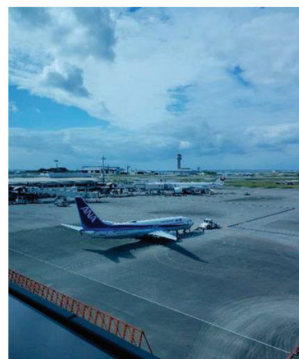
Gambar 1: Sekitar tempat pendaratan kapal-kapal terbang di Lapangan Terbang Naha, Okinawa

buah mulut warga tempatan. Penulis telah diiringi oleh wakil-wakil staf akademik,