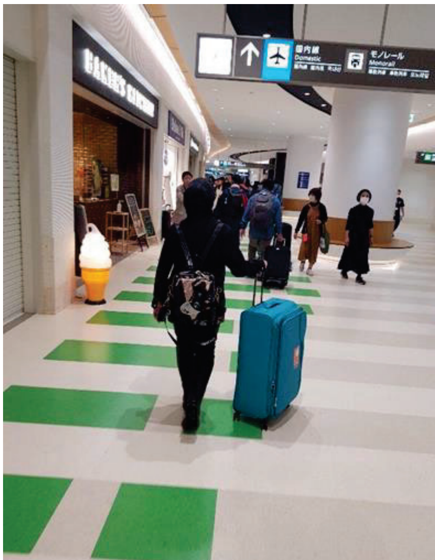
Gambar 2: Sekitar kompleks Lapangan terbang Naha, Okinawa yang sesak dengan penumpang dalam dan luar negara

Penulis tiba di Lapangan Terbang Naha pada awal pagi. Lapangan Terbang Naha merupakan lapangan terbang ketujuh paling sibuk di Jepun dan terminal udara utama untuk penumpang dan kargo yang melakukan perjalanan ulang-alik di Wilayah Okinawa, Jepun. Lapangan terbang ini mengendalikan trafik antarabangsa berjadual ke Taiwan, Hong Kong, Korea Selatan, Thailand, Singapura, Jerman dan China. Lapangan terbang ini juga menempatkan Pangkalan Udara Naha dari Pasukan Pertahanan Udara Jepun. Setibanya di sana, penulis mendapati keadaan lantai dan tandas lapangan terbang tersebut adalah sangat bersih. Walaupun terdapat ramai para pelancong dan orang tempatan berpusu-pusu di kompleks lapangan terbang ini, pihak pengurusan lapangan terbang ini berjaya memastikan kesejahteraan dan kebersihannya di tahap optimum. Penulis seterusnya menggunakan perkhidmatan monorel yang terletak berdekatan dengan lapangan terbang Naha. Penulis mendapati keadaan monorel sangatlah bersih. Keadaan yang senyap memastikan semua penumpang berada dalam keadaan aman dan tenteram. Penulis sempat