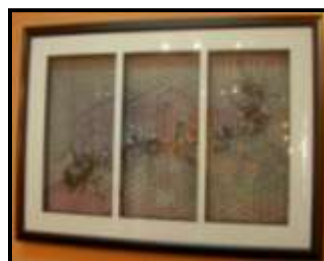
Anyaman yang dijadikan sebagai hiasan dinding

Gambaran diatas menunjukkan contoh anyaman yang telah dibingkaikan menjadi anyaman tiga siri memaparkan dimensi yang baru pada hamparan anyaman tikar. Anyaman tersebut turut dihiasi dengan satu tangkai hiasan bunga yang diperbuat daripada bahan logam yang ditampal pada permukaan anyaman tersebut. Ia bertujuan menjadikan anyaman tersebut kelihatan lebih menarik.