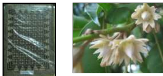
Motif bunga tanjung

Penggunaan jenis bunga dikaitkan dengan sesuatu adat resam dan budaya sesuatu bangsa sejak zaman nenek moyang kita lagi sehingga ke hari ini. Di Malaysia, bunga juga digunakan didalam kehidupan seharian sesuatu bangsa sebagai pewangi dikalangan masyarakat pelbagai kaum yang berbeza adat mengikut penggunaannya yang mempunyai makna yang tersendiri. Bunga yang mewangi memberi haruman yang dapat menusuk hidung sesiapa sahaja yang terbau dimana ia dapat menaikkan rasa segar dan nyaman kepada setiap orang. Kesegaran bauwan bunga semulajadi ini menjadikan bunga tanjung sebagai salah satu bunga yang sangat digemari oleh masyarakat melayu. Bunga tanjung digunakan dalam perhiasan diri dengan diletakkan diatas sanggul kepala kerana tarikan bau wangi yang sangat kuat dan tahan lama.