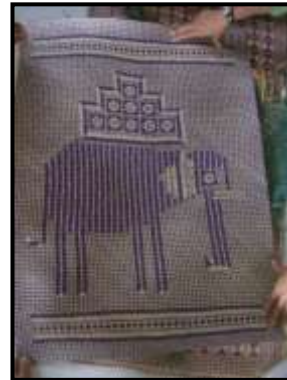
Anyaman tikar mengkuang yang menggunakan motif gajah sedang membawa barangan.