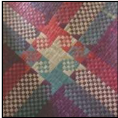
Kelarai mata berkait

Berikut merupakan contoh anyaman kelarai yang dihasilkan bagi mendapatkan motif dan corak yang bertanggungjawab menghiasi permukaan anyaman yang dihasilkan samaada pada sebidang tikar alas duduk atau hiasan rumah semata-mata. Anyaman jenis ini berbeza dengan anyaman biasa kerana dapat menghasilkan motif berbanding dengan anyaman biasa yang tidak mempunyai motif tetapi dapat menghasilkan rekacorak melalui penggunaan warna yang berbeza.