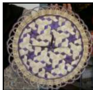
Anyaman bakul yang dihasilkan sebagai jam dinding.

Bagi menarik minat golongan muda serta pelancong asing terhadap seni anyaman melayu, kepelbagaian jenis produk anyaman dihasilkan dan tidak hanya lagi memberi penumpuan pada anyaman tikar semata-mata. Hasil kreativiti para pengaryam amat diperlukan bagi mengikut peredaran masa serta permintaan pasaran kerana ia boleh menjamin masa depan para pengaryam.