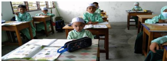
Gambar 2: Ketika pelajar sedang dilatih bertutur

BBM ini amat penting, ini kerana pelajar dilihat lebih berminat jika terdapat kepelbagaian teknik dalam P&P. Pemilihan BBM yang menarik seperti kad kod perkataan Arab juga membantu dalam menarik minat pelajar untuk lebih yakin bertutur dalam bahasa Arab. Kad kod ini perlu bersesuaian dalam waktu P&P supaya pelajar dapat menguasai bahasa Arab sama ada dengan menghafal perkataan atau berdialog antara guru semasa waktu P&P.