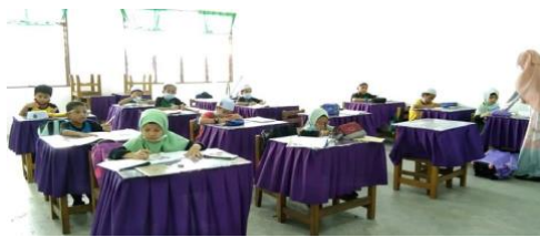
Gambar 3: Pelajar sedang dilatih menulis perkataan