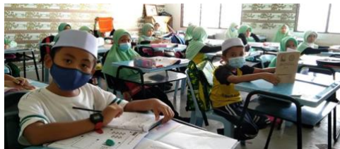
Gambar 1: Ketika pelajar sedang mendengar guru membaca

Hasil pemerhatian pengkaji, di sekolah Rendah Islam Darul Bayan telah menggunakan salah satu BBM mendengar dengan penggunaan audio rakaman suara berbentuk perkataan, ayat, dialog, pidato, iklan dan lain-lain. Pendengaran yang aktif merangkumi proses mendengar dengan tujuan untuk memahami, mengingat, menilai dan mengkritik. Kaedah mendengar ini tidak dapat dipisahkan dengan kaedah bertutur, kerana ianya adalah satu proses mengeluarkan ungkapan yang telah didengar. Contohnya, seorang pelajar itu telah mendengar audio rakaman berbentuk dialog, maka untuk menguji tahap pendengarannya pelajar itu perlu bertutur atau dengan kata mudah menyebut kembali apa yang telah didengarnya. Proses ini untuk memastikan kaedah mendengar dapat diterima oleh pelajar.