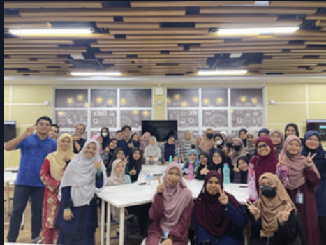
Kuiz Bahasa Arab (Berkumpulan)