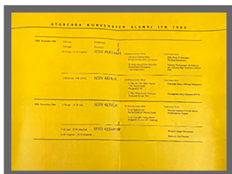
Atur cara Konvensyen

Dalam ucapannya Menteri Pelajaran menyeru para lepasan ITM agar membuktikan potensi sebagai pekerja atau usahawan yang memenuhi kriteria yang dikehendaki oleh majikan, bangsa dan negara. Mereka hendaklah menjadi individu penyambung usaha dan hasrat ITM untuk memastikan kaum bumiputera benar-benar berjaya sesuai dengan Dasar Ekonomi Baru.