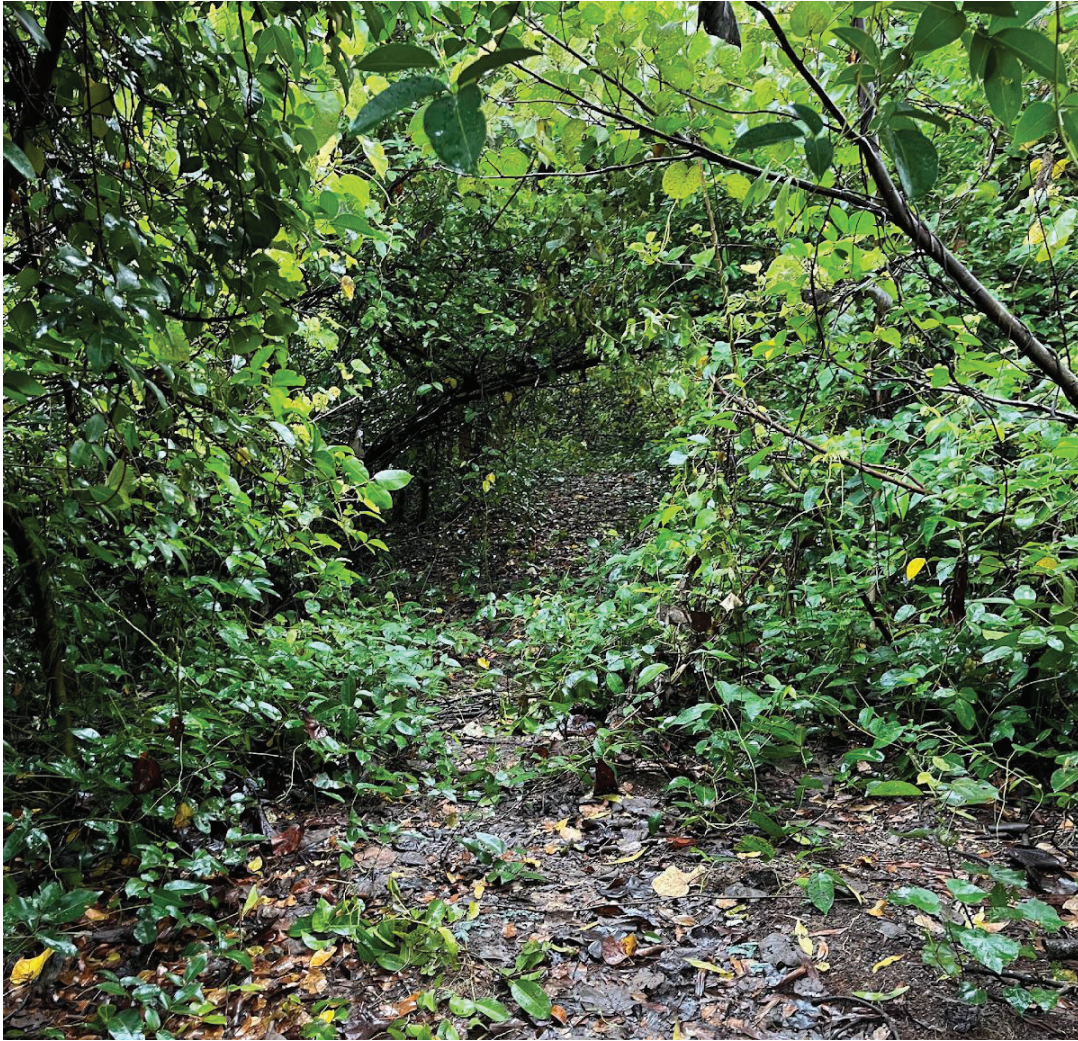
Gambar 2: Tempat jatuh lagi dikenang, ini kan pula tempat bermain. Lokasi: Tanah Bencah, UMT, Terengganu