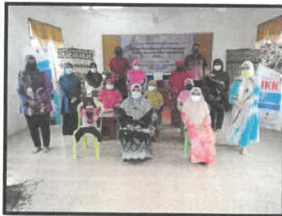
Rajah 7: Kursus anyaman