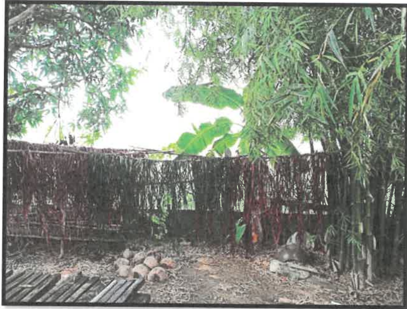
Rajah 21: Daun dikeringkan dan siap untuk digunakan