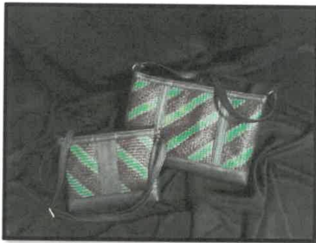
Rajah 12: Beg tangan