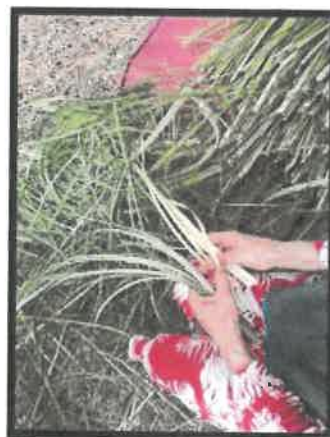
Rajah 18: Daun tersebut akan dilurus supaya tidak menggerutu dan dilaraikan sehingga halus