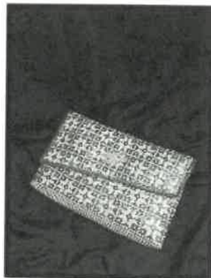
Rajah 10: Beg Klac (Clutch bag)