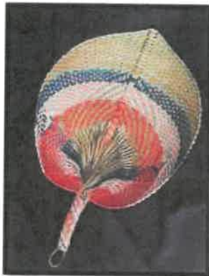
Rajah 9: Kipas tangan