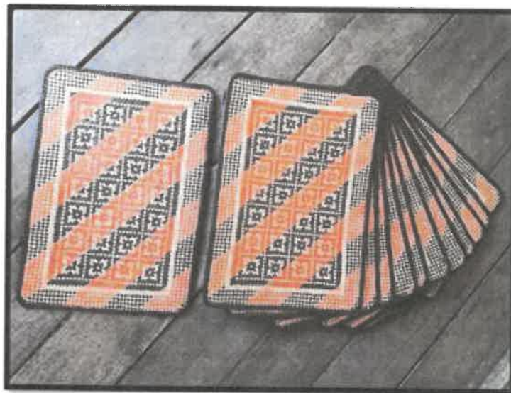
Rajah 15: Tikar kelarai kecil