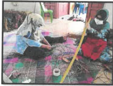
Rajah 5: Suasana aktiviti kelas anyaman