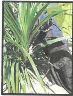
Rajah 16: Hujung pangkal daun dipotong