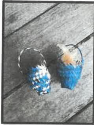
Rajah 8: Bekas telur