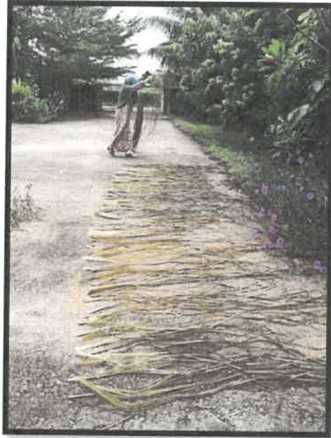
Rajah 19: Daun tersebut akan dijemur di bawah matahari