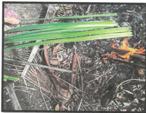
Rajah 17: Daun dilayur di atas bara api dan dibuang duri daunnya