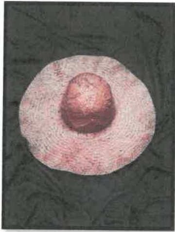
Rajah 11: Topi