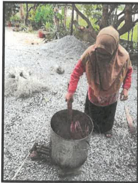
Rajah 20: Proses mewarna daun