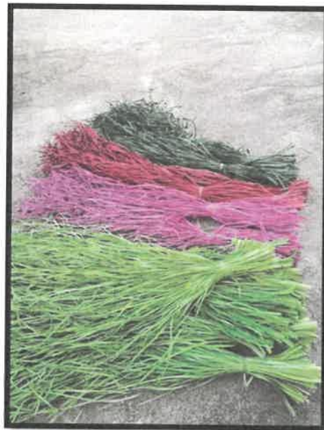
Rajah 22: Daun yang siap diwarnakan