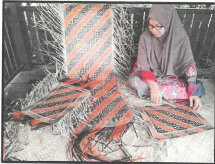
Rajah 4: Tokoh sedang menganyam