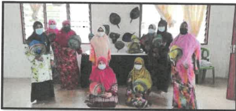
Rajah 6: Tokoh bersama orang kampung yang mengikuti kelas anyaman