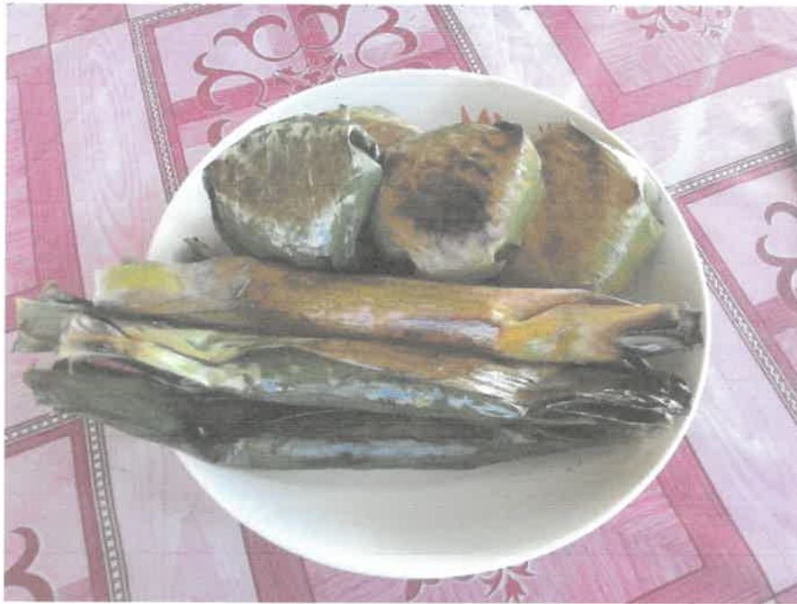
Gambar 3: Gambar pulut lepa dan pulut bakar yang dibuat oleh Cek Dah