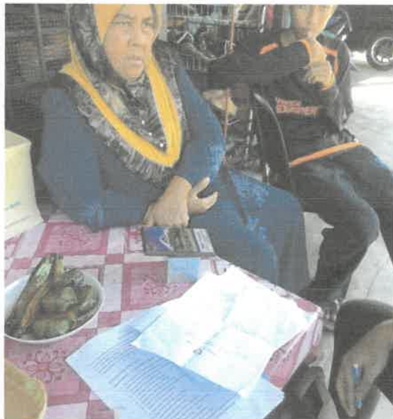
Gambar 4: Gambar Cek Dah bersama anak bongsu nya.