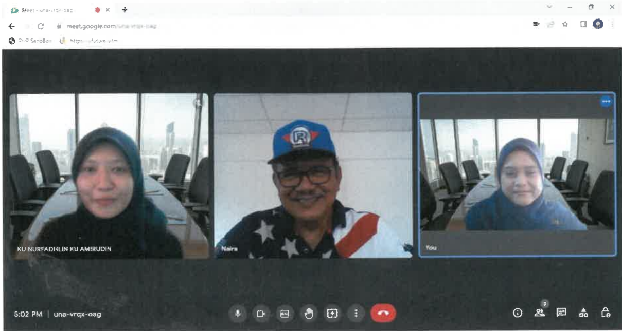
Gambar 9: Google Meet bersama tokoh Rahim Omar semasa sesi temubual.