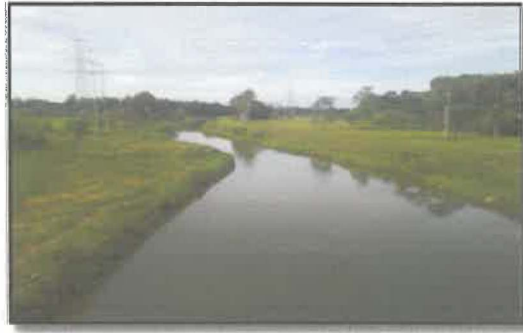
Gambar 2 : Sungai Lundang

Keadaan Sungai Lundang sekarang tidak lagi sepertimana zaman kegemilangannya dimana muara sungainya dahulu adalah dalam dan luas. Pemandangan Sungai Lundang di Kampung Lundang dari Jambatan Jalan Tengku Muhammad Maa'sum (Jalan Baru Telipot-Pasir Hor) sekarang.