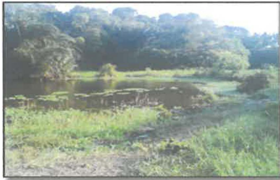
Gambar 1 : Sungai Lubuk Mulong

Kampung Lundang yang mana melibatkan dua zaman berbeda iaitu zaman Tradisional dan zaman Moden. Tumpuan khas juga diberikan kepada sejarah raja-raja Kampung Lundang yang merupakan pembesar-pembesar daerah Lundang dari peringkat awal hingga kepada yang terakhir. Lundang merupakan sebuah mukim dan bandar di daerah Kubang Kerian, Kota Bharu, Kelantan. Menurut catatan sejarah, Kampung Lundang adalah salah sebuah kampung yang tertua selepas Kampung Kota Jelasin, Kampung Che Bu dan Kampung Kubang Garom. Kampung Lundang juga adalah merupakan sebuah kampung paling besar di antara kampung-kampung lain dalam kawasan Kota Bharu, ibu negeri Kelantan sekarang.