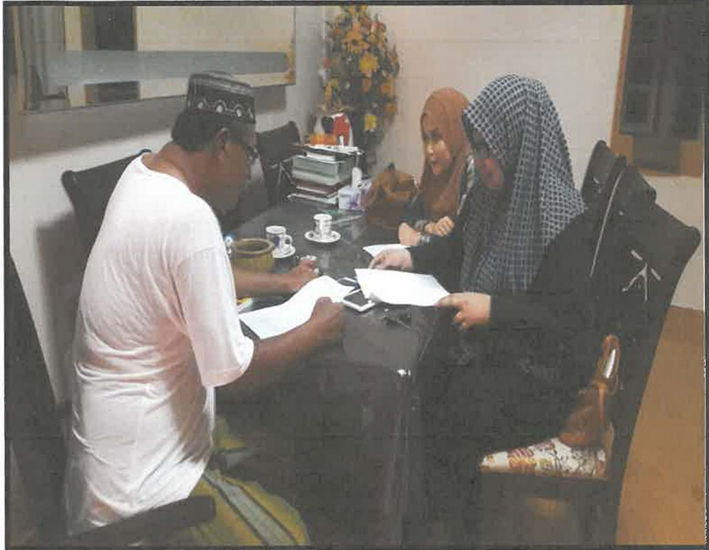
Gambar 4 : Situasi semasa penceritaan