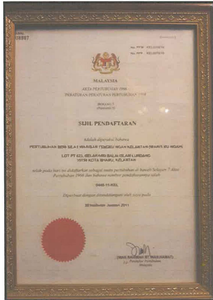
Gambar 3 : Sijil Pertubuhan Seni Silat Warisan Tengku Ngeh Kelantan