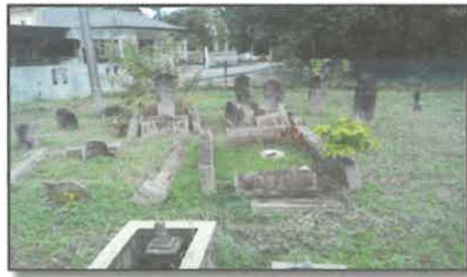
Gambar 3 : Makam Raja-Raja Lundang

Keadaan Sungai Lundang sekarang tidak lagi sepertimana zaman kegemilangannya dimana muara sungainya dahulu adalah dalam dan luas. Pemandangan Sungai Lundang di Kampung Lundang dari Jambatan Jalan Tengku Muhammad Maa'sum (Jalan Baru Telipot-Pasir Hor) sekarang.