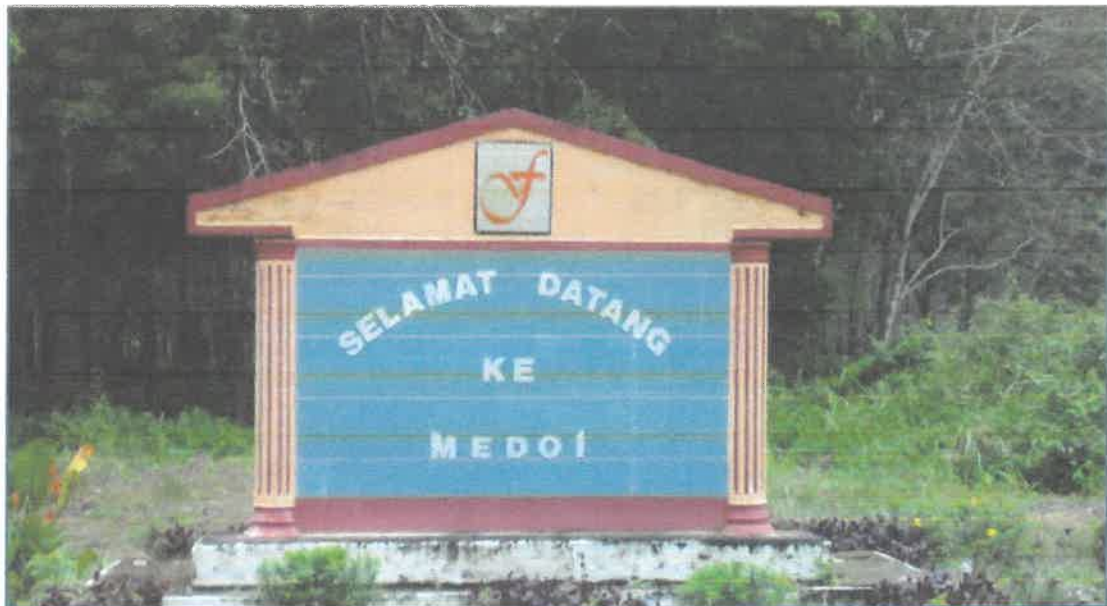
Papan tanda Felda Medoi