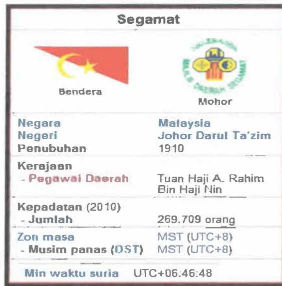
Gambar 2: Maklumat mengenai Segamat

Nama Segamat dipercayai berasal daripada gabungan dua perkataan Melayu berikut - Segar-Amat. Terletak di antara Kuala Lumpur dan Singapura, Segamat merupakan daerah dimana sektor pertanian berkembang dengan pesat seperti kelapa sawit dan getah yang kebanyakannya ditanam di estet-estet dan di tanah rancangan FELDA serta FELCRA. Segamat terkenal dengan buah-buahan terutamanya durian. Sebagai tarikan pelancong, slogan baru telah diperkenalkan iaitu 'Selamat Datang ke Segamat – Tanah Raja Buah-buahan'.