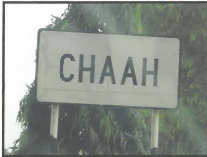
Gambar 3: Chaah

Mukim Chaah merupakan salah sebuah mukim yang terdapat dalam negara Johor, dan juga merupakan satu dari mukim yang terletak dalam pentadbiran Daerah Segamat. Chaah adalah pekan paling selatan dalam daerah Segamat, Johor. Jarak antara Bandar Segamat ke Chaah ini mengambil masa 1 jam dan lebih kurang 38 km. Walaupun Chaah ini hanya sebuah pekan yang kecil tetapi ianya mempunyai sejarah yang tersendiri selain mempunyai tempat-tempat yang menarik seperti "Darling Walk" dan padang golf.