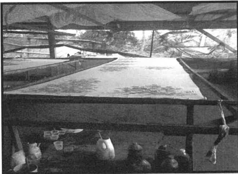
Gambar 4: Proses membuat batik