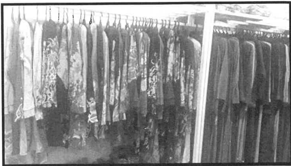
Gambar 2: Batik yang dijual oleh Encik Sanusi