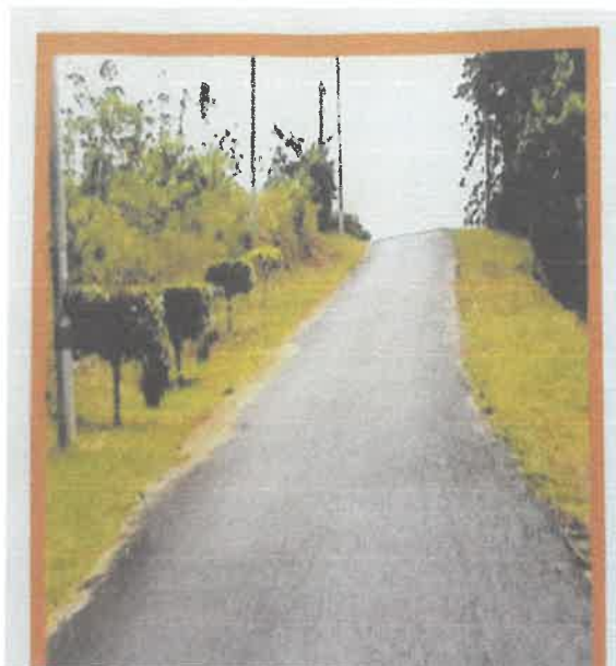
Jalan bertanah yang sudah dtukarkan menjadi jalan tar