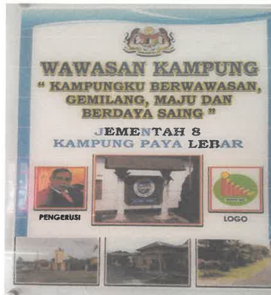
Ini merupakan lampiran wawasan kampung