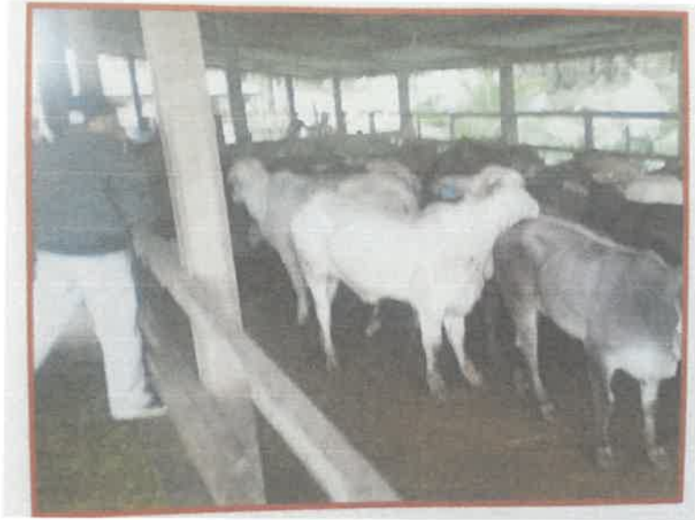
Contoh aktiviti penternakan