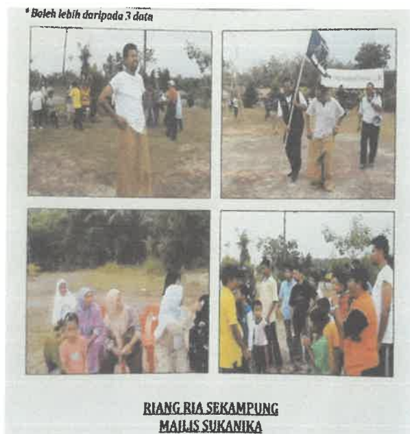
Contoh aktiviti yang di jalankan