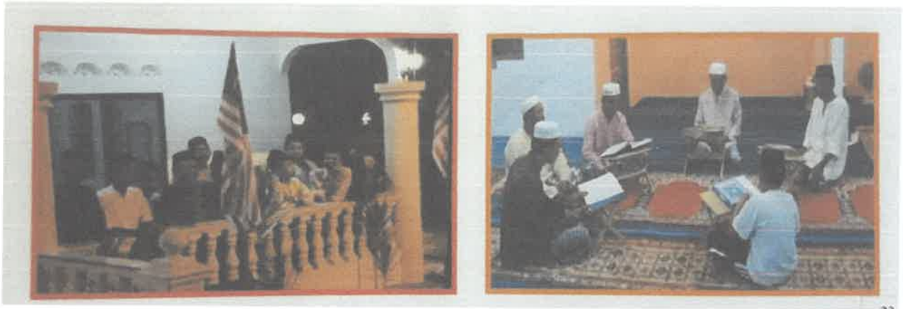
Contoh aktiviti surau dan masjid