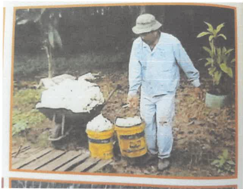
Contoh aktiviti pertanian