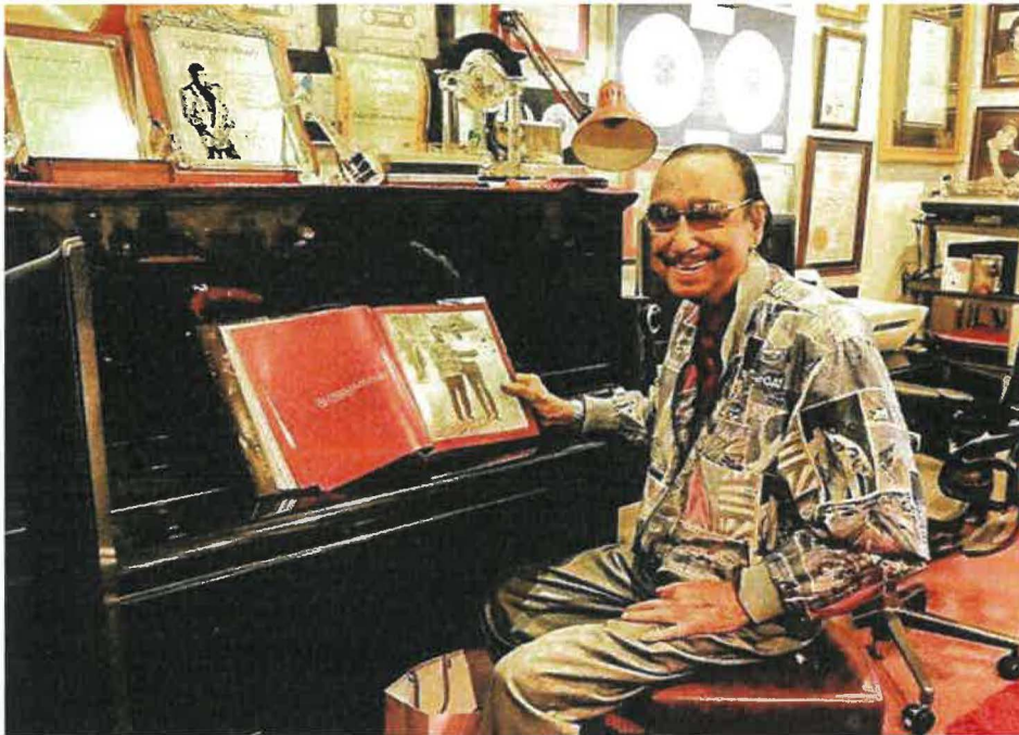
Gambar Rajah 4: Datuk Seri dalam bilik muziknya