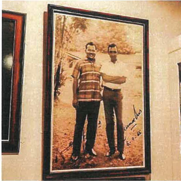
Gambar Rajah 1: Dato' Seri bersama sahabat baiknya, Tan Sri P. Ramlee