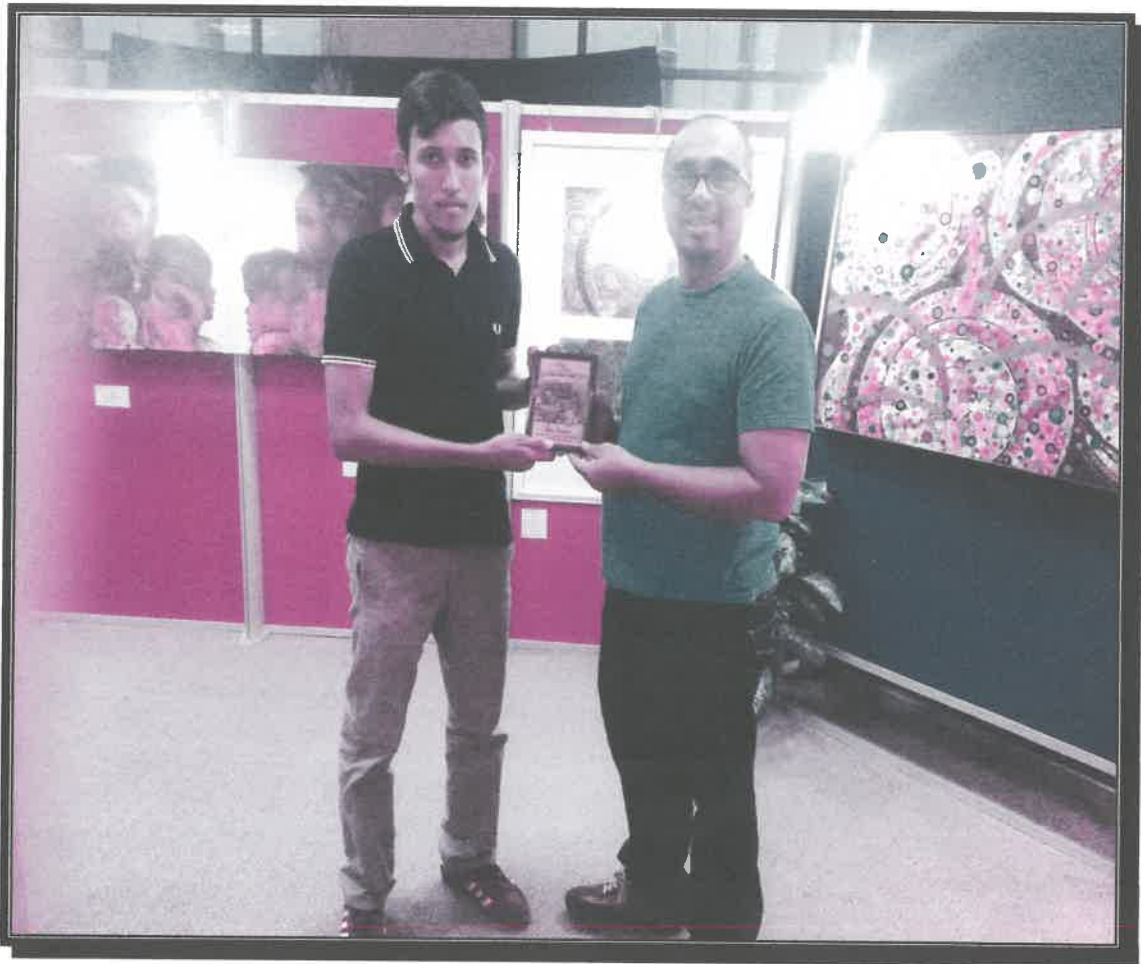
Gambar 3: Penyampaian Saguhati