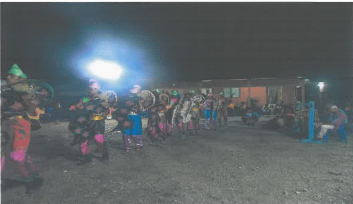
Gambar 4: Tarian kuda kepang