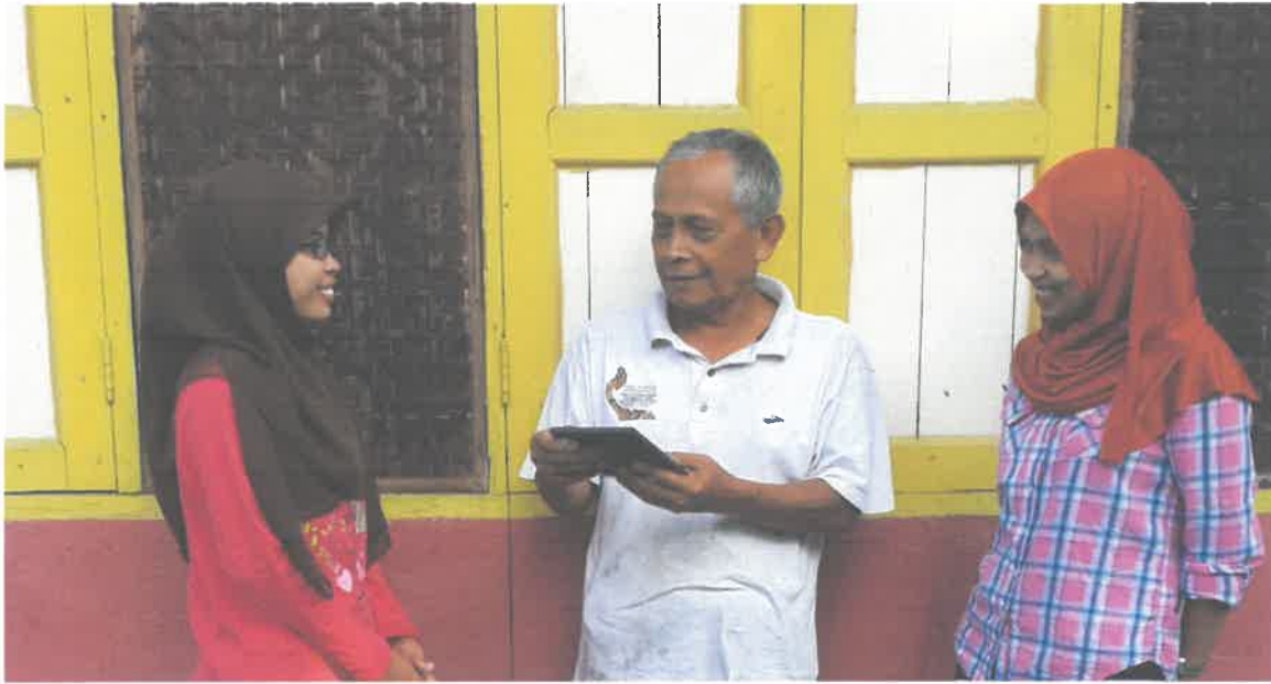
Gambar 7: Pemberian Plak sebagai Penghargaan (hari kedua)