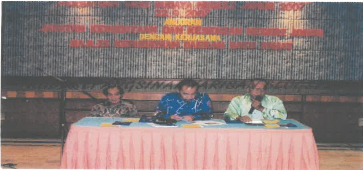
BICARA TOKOH SENI DAN WARISAN 2007