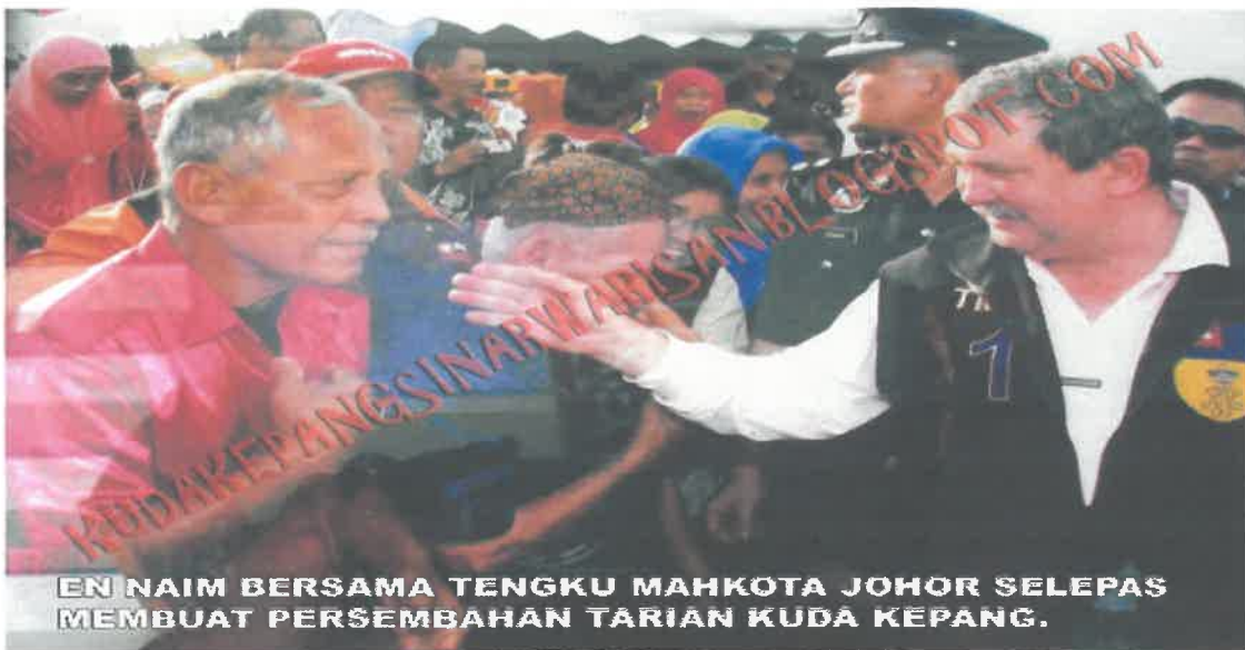
Gambar 13: Bersama Tengku Mahkota Johor