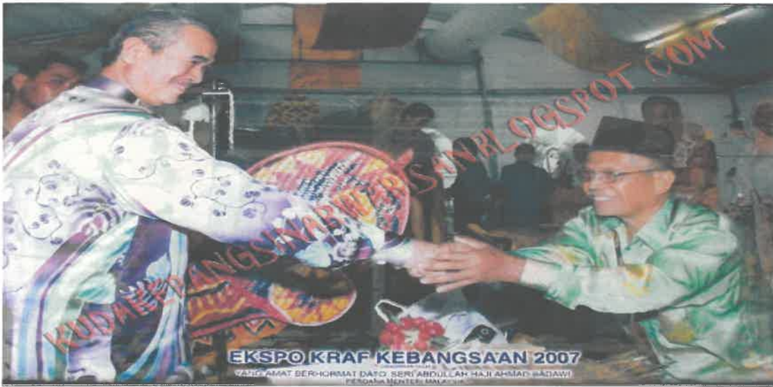
Gambar 12: Gambar bersama Perdana Menteri ke-4