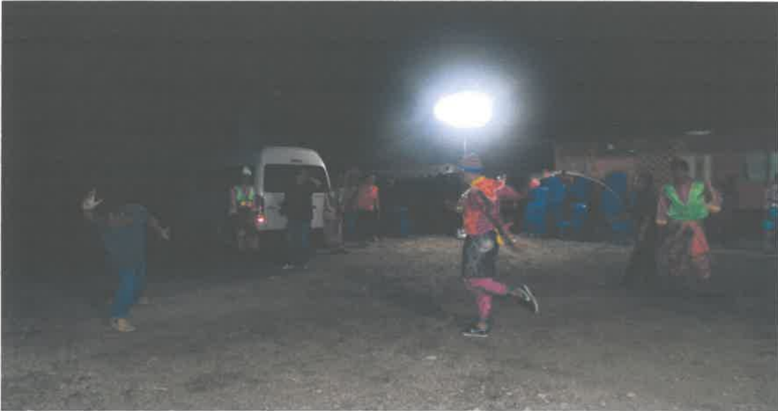
Gambar 5: Ketua tarian memegang tali cemerti