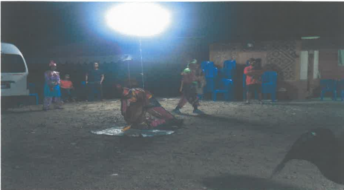
Gambar 6: Penari yang dirasuk menunjukkan kehebatannya