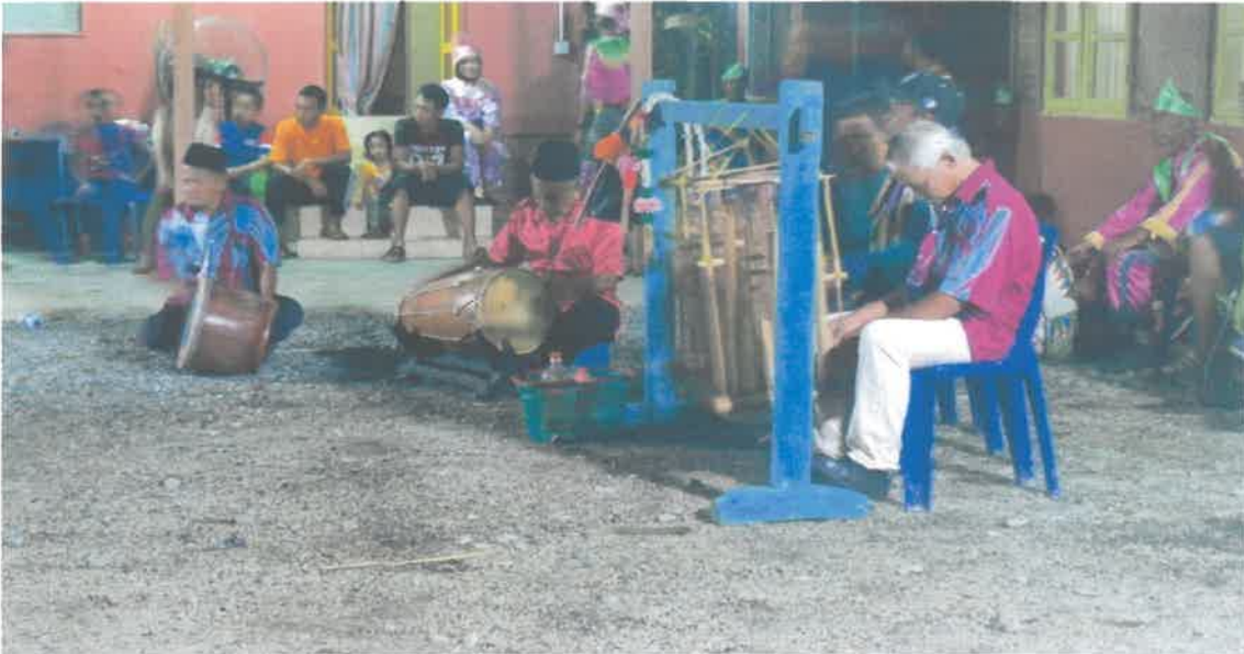
Gambar 3: Alat muzik yang digunakan semasa persembahan