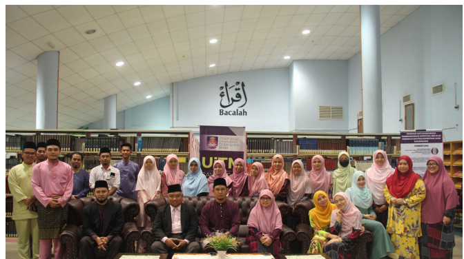
Gambar bersama Jawatankuasa Seminar

Seminar yang diadakan ini telah mendapat sambutan yang menggalakkan dan komen yang positif daripada penonton samada secara maya melalui siaran langsung di YouTube atau