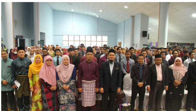
Gambar bersama peserta secara fizikal