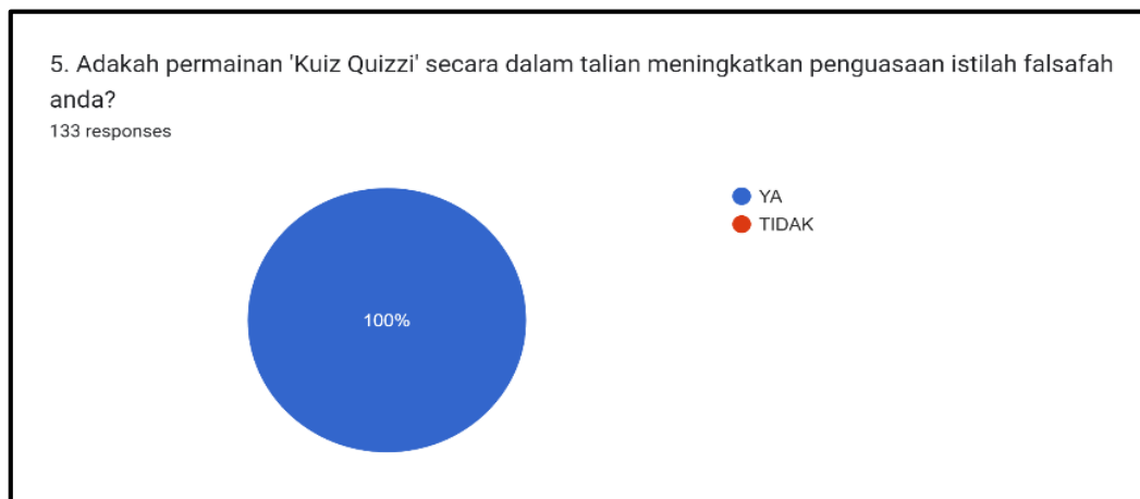
Rajah 4. Carta Tinjauan Kaji Selidik

Hasil kaji selidik terhadap 133 orang pelajar yang mengambil FIS, mendapati 100% pelajar bersetuju Quizzi secara dalam talian membantu meningkatkan penguasaan istilah falsafah (Rajah 4). Merujuk rajah 5, 81% tahap kefahaman pelajar adalah cemerlang dan 22% sangat cemerlang berkaitan istilah falsafah selepas permainan Quizzi.