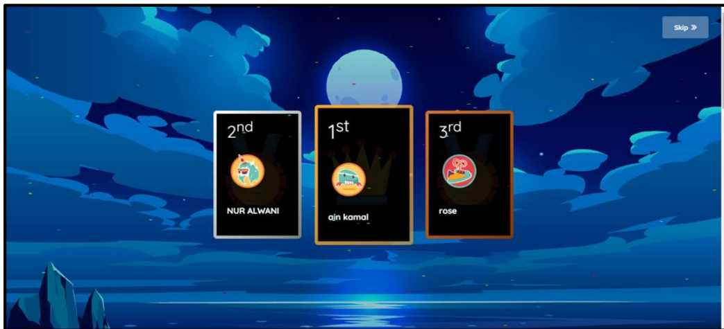
Gambar 4. Keputusan Kedudukan Pertama, Kedua dan Ketiga Skor Tertinggi dan Terpentas