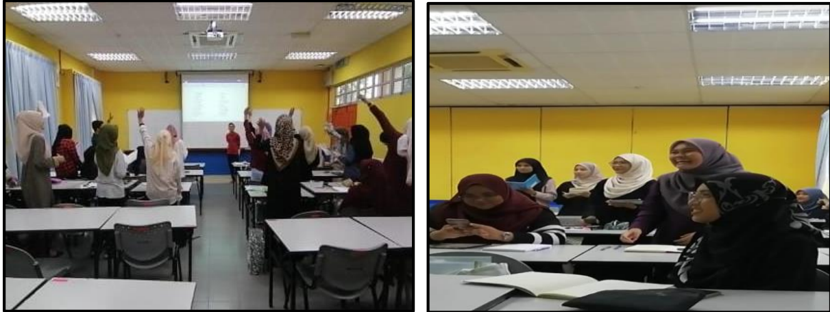
Gambar 2. Aktiviti Permainan Istilah Fizikal Go di Bilik Kuliah

Tujuan permainan istilah falsafah Go ini adalah untuk pelajar lebih aktif dan pantas mencari definisi-definisi terminologi dalam ilmu falsafah dengan menggunakan smart phone masing-masing. Mereka perlu fokus pada arahan ketua kelas untuk melakukan pergerakan tertentu bagi menjawab istilah berkaitan. Mereka dibenarkan duduk jika jawapan tepat dan terus kekal berdiri jika tidak bertepatan. Lima pelajar terakhir yang masih berdiri akan dikenakan denda ilmiah oleh rakan-rakan kelas. Dengan kaedah pantas ini dilihat membantu pelajar untuk mengingat definisi terminologi dalam falsafah.