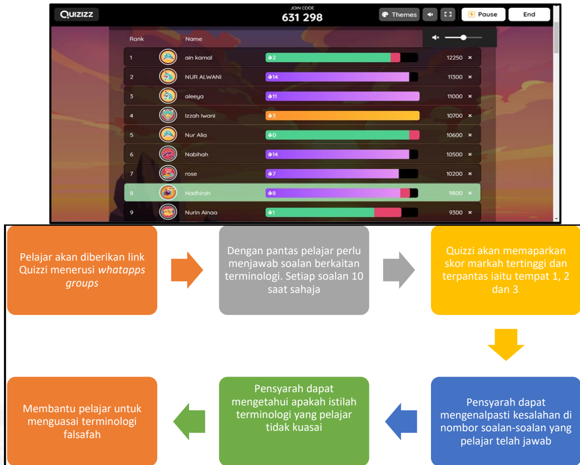
Rajah 3. Proses Permainan Quizzi Istilah Dalam Talian

Permainan fizikal Go diintegrasikan dengan permainan Quizzi dalam talian. Permainan secara dalam talian ini diberi kepada pelajar pada minggu kuliah berikutnya. Kaedah ini lebih meningkatkan penguasaan istilah para pelajar. Rajah 2 merupakan proses permainan Quizzi istilah :