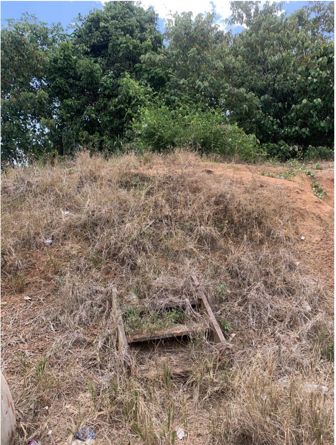
Tapak Peninggalan Rumah Pasong Kampung Tebing Tinggi