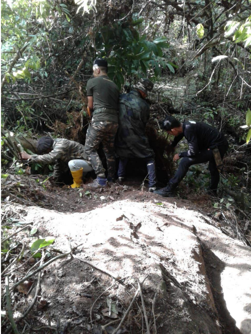
Figure 11.4.3: Photos From 2019 Cleaning The Stone From The Bushes