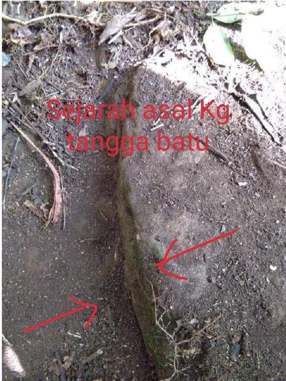
Figure 11.4.6: Photos from 2019 show the stone structure