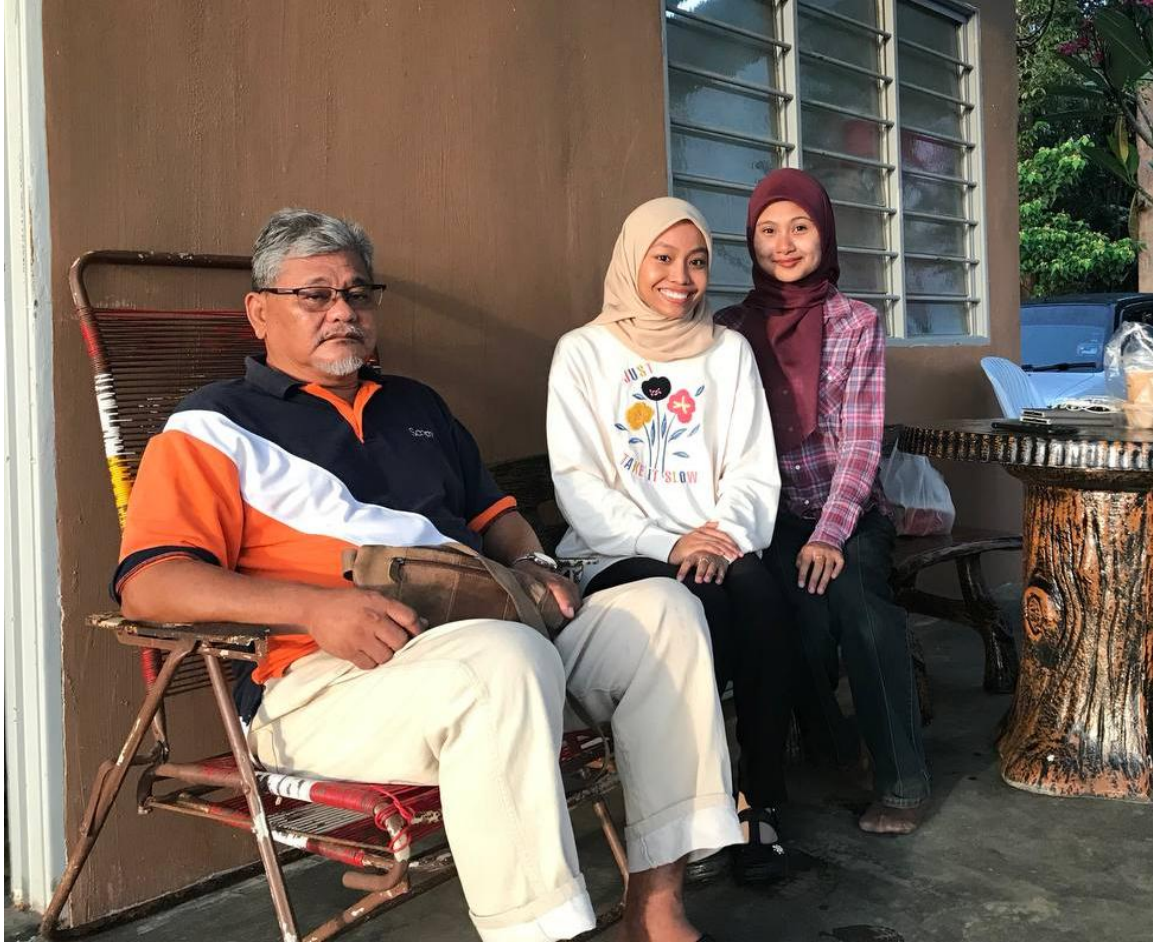
Figure 11.4.7: Second Meeting Session