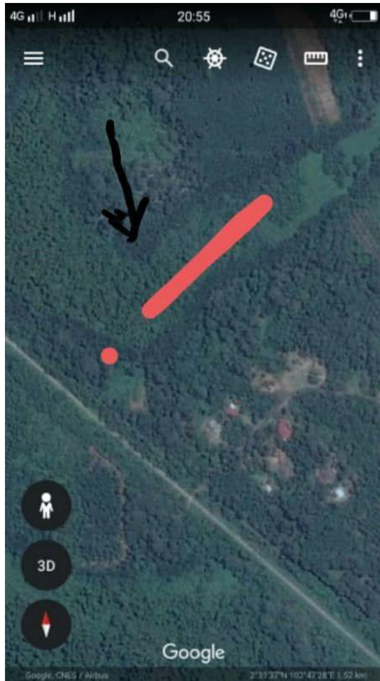
Figure 11.4.2: Location Of Tangga Batu On Map