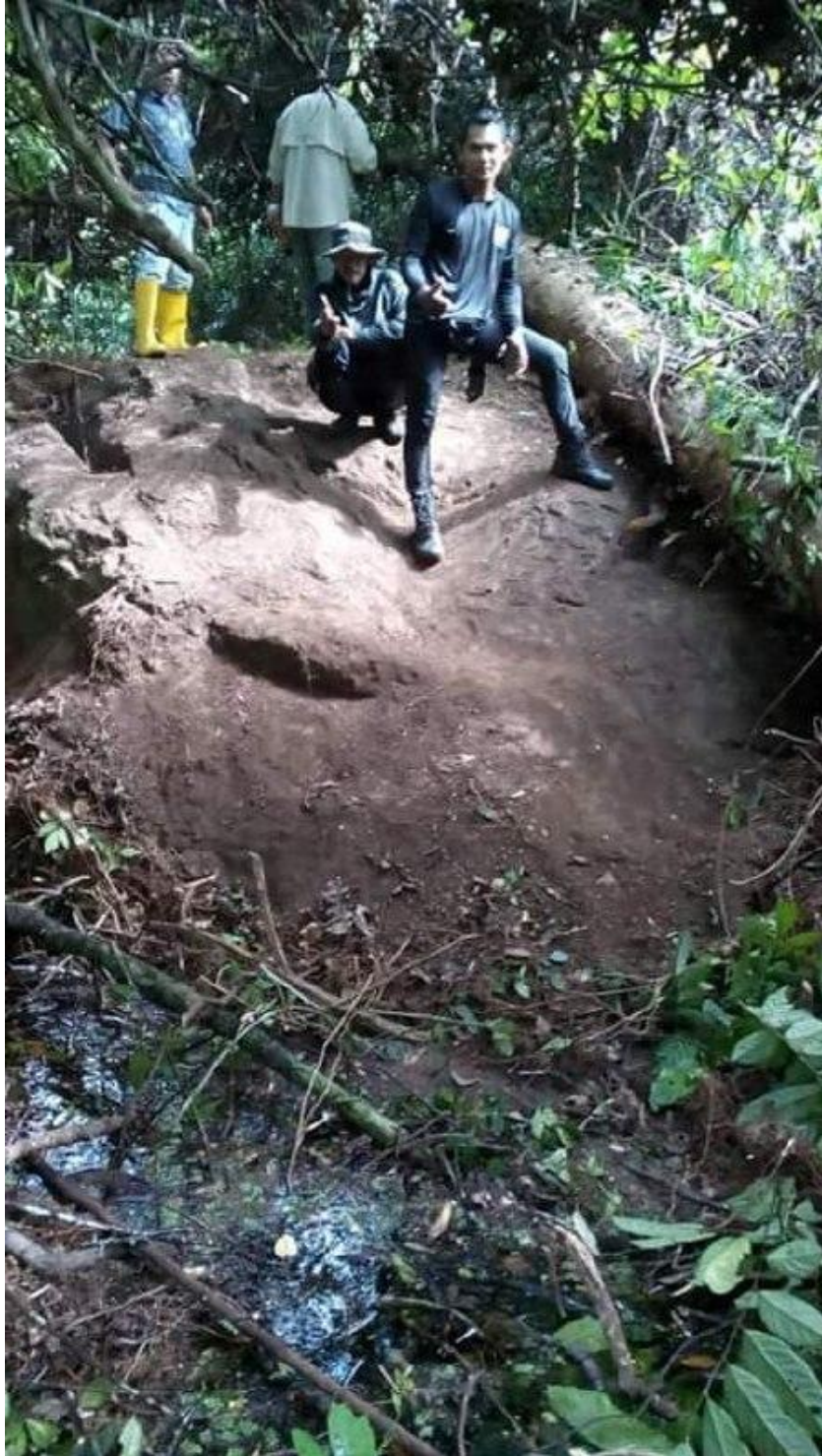
Figure 11.4.4: Photos From 2019 Cleaning The Stone From The Bushes