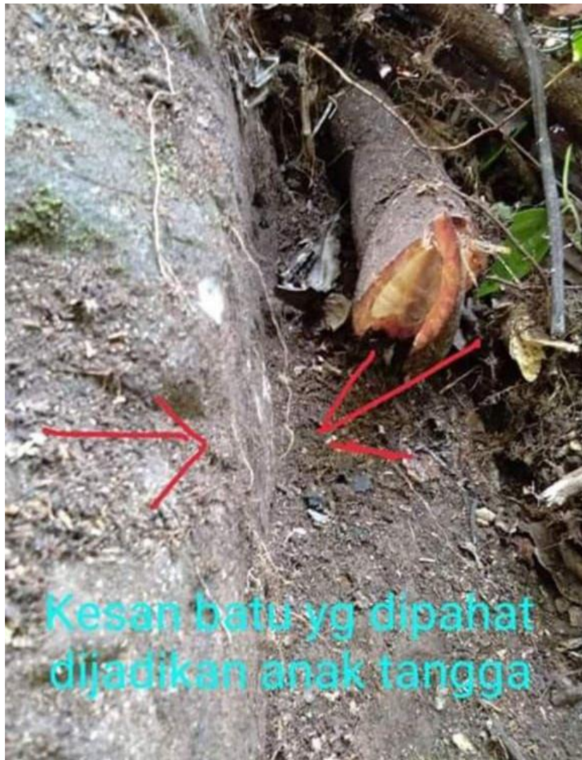
Figure 11.4.5: Photos From 2019 Show The Stone Structure