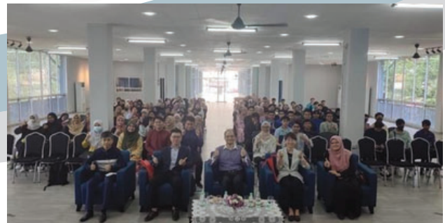
Rajah 2 Penceramah jemputan bersama para pelajar yang menyertai program bertempat di Dewan Anjung Perpatih, UiTM Cawangan Negeri Sembilan, Kampus Kuala Pilah.