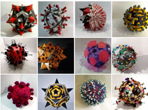
Rajah 5: Variasi karya akhir

Pelbagai variasi karya akhir yang lain seperti Rajah 5 menunjukkan kemampuan pelajar mengadaptasi struktur asal Covid-19 kepada olahan seni yang baru sebagai pernyataan seni. Kedapatan aspek stailisasi sesetengah pelajar mencapai hampir melebihi 50% keaslian struktur asal Covid-19 kepada visual seni yang baru. Penerokaan media dan teknik yang bersungguh juga dilihat amat berkesan terutama terhadap spike Covid-19 yang agak sukar untuk diolah semula. Arca yang berskala kecil ini sememangnya garapan baharu para pelajar yang masih hijau dalam penghasilan karya seni dan ini juga merupakan latihan dan langkah awal pelajar sebelum bergerak lebih jauh lagi untuk mendalami aspek seni yang sebenar dalam menghasilkan apa jua bentuk seni visual di masa depan.