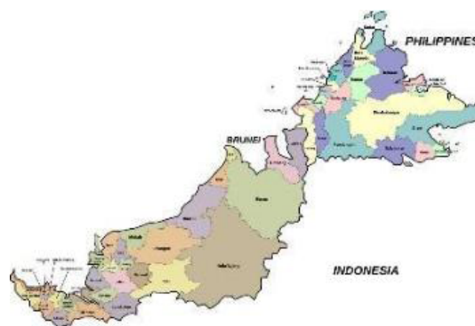
Gambar 1: Peta daerah-daerah Sabah dan Sarawak

ada di peringkat sekolah atau institusi pengajian tinggi. Penguatkuasaan seperti (PKP) dan SOP sekaligus memberi kesan kepada cara dan norma baharu untuk mengharungi kehidupan seharian. Melihat dari sudut pengajaran dan pembelajaran (PdP) dan proses berkarya pada pelajar seni halus yang keutamaan secara alaminya adalah “studio-practice-based”. Disebabkan kekangan ini maka kaedah PdP diploma seni halus UiTM cawangan Sarawak telah diubahsuai mengikut inovasi studio di rumah (Bauman, K. J : 2002) atau “home-studio-based”. Majoriti pelajar Diploma Seni Halus UiTM Sarawak ini berasal daripada pelusuk zon Sarawak dan daerah di Sabah. Taburan pelajar yang berasal dari Sarawak bermula dari Bahagian Kuching sehingga ke Bahagian Lawas. Hampir semua zon dari timur dan selatan ada pelajar yang terlibat dengan Pdp ini sekurang-kurangnya seorang. Pelajar-pelajar yang berasal dari Sabah pula ada yang berada di Kota Kinabalu, Ranau, hinggalah ke Tawau. Walaupun jumlahnya kurang dari pelajar dari Sarawak namun geografi dan lokasinya memberikan cabaran yang hampir sama. Taburan demografik pelajar seni halus di UiTM Sarawak adalah lebih kurang 60% pelajar pameran berasal dari Sarawak dan 40% berasal dari Sabah.