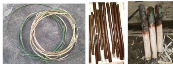
Gambar 3 : Contoh bahan yang digunakan pelajar, Elsie Maikol, yang didapati dari sumber hutan daerah Ranau Sabah.

Walaubagaimanapun pelbagai keterbatasan kaedah PdP ini juga dapat dikesan. Pertama adalah dalam pemilihan bahan di dalam karya mereka serta penggunaan mesin-mesin pemotong kayu untuk menghasilkan karya seni arca dan juga bahan-bahan untuk karya cetakan yang amat terhad. Peralatan-peralatan utama untuk PDP seperti mesin, hanya ada di bengkel atau studio Jabatan Seni Halus. Tidak ramai ibubapa yang boleh menyediakan mesin-mesin yang diperlukan dalam pembelajaran arca di rumah. Perkara inilah yang menjadi kekusaran para pensyarah dan pelajar. Hal ini bukan masalah sekiranya berada di kampus. Peralatan disediakan dan pensyarah sentiasa ada untuk memberi tunjuk ajar penggunaan mesin dan peralatan. Tetapi ada juga beberapa pelajar yang menggunakan bahan asas hutan sebagai bahan gantikan untuk menyelesaikan karya akhir mereka.