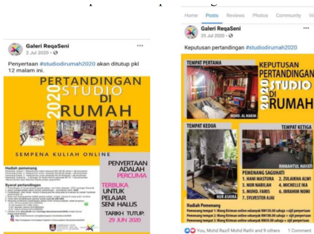
Gambar 2: kiri:-Poster pameran studio di rumah siri 1 ; kanan :-adalah poster keputusan pemenang pertandingan tersebut

Dalam rangka kurikulum silibus kursus tahun akhir diploma seni halus adalah 100% diselia secara bersemuka oleh pensyarah bagi menyelesaikan tugas kursus utama mereka iaitu lukisan, catan, cetakan dan seni arca. Tetapi situasi pandemik ini telah memaksa pensyarah untuk menukar kaedah PdP asal kepada 100% ODL. Maka dengan ini pensyarah di jabatan seni halus UiTM cawangan Sarawak yang telah mengubah secara total akan perincian terhadap PdP kurikulum berlandaskan 'Studio-Practice-Based' kepada home-studio based iaitu melalui pendekatan pertandingan Studio di Rumah.