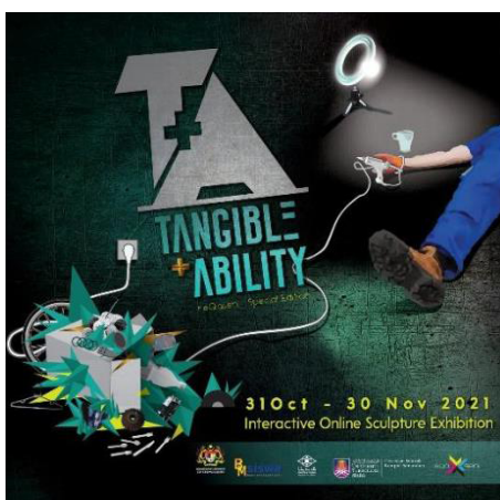
Gambar 6: Pameran virtual karya Seni Arca Tangible + Ability sempena pameran Bakat Mahasiswa anjuran Balai Seni Negara 31 oktober -30 November 2021

Tambahan lagi sekiranya pameran secara maya dijalankan , jumlah audien yang dapat melihat pameran tersebut potensinya amat luas. Walaubagaimanapun pameran sebegini akan memberi kesan akan institusi -institusi galeri itu sendiri malahan akan meberi impak pada